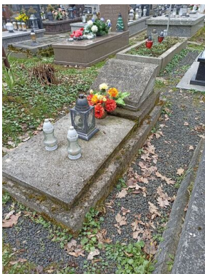
Grób przed odnowieniem

Bronisław Kopystyński zmarł 25 czerwca 1924 r. i został pochowany na cmentarzu Rakowickim w Krakowie. Jego grób został wpisany do ewidencji grobów weteranów walk o wolność i niepodległość Polski.