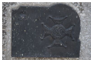
Grób powstańca styczniowego Ludomira Benedyktowicza.