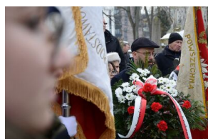
161. rocznica wybuchu powstania styczniowego. Uroczystość na cmentarzu Rakowickim.