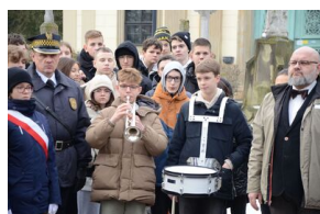
161. rocznica wybuchu powstania styczniowego. Uroczystość na cmentarzu Rakowickim.