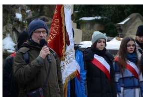
161. rocznica wybuchu powstania styczniowego. Uroczystość na cmentarzu Rakowickim.