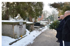
Grób powstańca styczniowego Ludomira Benedyktowicza.