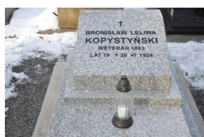
IPN odnowił grób powstańca styczniowego Bronisława Kopystyńskiego.

22 stycznia 2024 r., w 161. rocznicę wybuchu powstania styczniowego, na cmentarzu Rakowickim, przy sfinansowanym przez Oddział IPN w Krakowie nowym nagrobku powstańca Bronisława Kopystyńskiego (1844-1924), odbyła się krótka uroczystość.