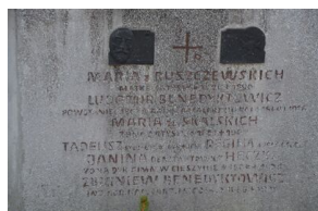
Grób powstańca styczniowego Ludomira Benedyktowicza.

styczniowego, zorganizowanych przy mogile powstańców przez Ośrodek Edukacji Obywatelskiej filię nr 1 Centrum Młodzieży im. dr. H. Jordana w Krakowie.