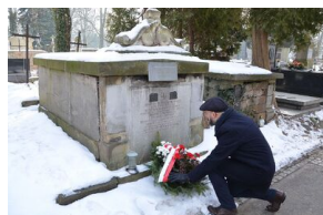
Grób powstańca styczniowego Ludomira Benedyktowicza.