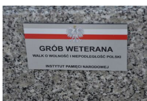
IPN odnowił grób powstańca styczniowego Bronisława Kopystyńskiego.