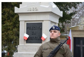
161. rocznica wybuchu powstania styczniowego. Uroczystość na cmentarzu Rakowickim.