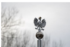
161. rocznica wybuchu powstania styczniowego. Uroczystość na cmentarzu Rakowickim.

W 2023 r. krakowski IPN wybudował i wyremontował 18 grobów, w tym 9 grobów weteranów walk o wolność i niepodległość Polski oraz 9 grobów wojennych. Spośród dziewięciu grobów weteranów w ub. roku krakowski IPN wyremontował dwa (w Krakowie i Nowym Targu) oraz sfinansował siedem nowych nagrobków (w Krakowie, Kielcach i Luborzycy). Są to nagrobki żołnierzy Legionów Polskich, obrońcy Lwowa w 1918 r., żołnierzy Armii Krajowej, działacza Zrzeszenia „Wolność i Niezawisłość” i więźnia komunizmu, jak również powstańca styczniowego i powstańca krakowskiego.