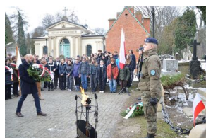
161. rocznica wybuchu powstania styczniowego. Uroczystość na cmentarzu Rakowickim.