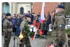
161. rocznica wybuchu powstania styczniowego. Uroczystość na cmentarzu Rakowickim.