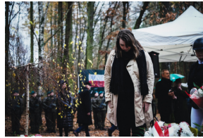
Uroczysty pogrzeb szczątków nieznanych z imienia i nazwiska żołnierzy Wojska Polskiego