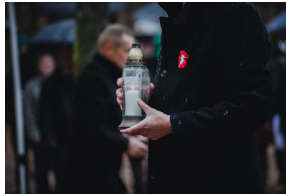
Uroczysty pogrzeb szczątków nieznanych z imienia i nazwiska żołnierzy Wojska Polskiego