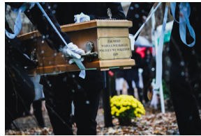
Uroczysty pogrzeb szczątków nieznanych z imienia i nazwiska żołnierzy Wojska Polskiego