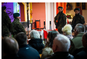
Uroczysty pogrzeb szczątków nieznanych z imienia i nazwiska żołnierzy Wojska Polskiego - fot.

Kondukt żałobny w asyście kompani reprezentacyjnej WP i orkiestry wojskowej ruszył w kierunku Krąplewic, by po trzech kilometrach dotrzeć do kwatery wojennej, gdzie w 2012 roku zostało pochowanych 44 Polaków - dzieci, kobiet oraz żołnierzy WP - ofiar niemieckiego bombardowania lotniczego okolic Gródka z dnia 3 września 1939 r. W 2021 r. w miejscu pamięci spoczęła również trójka żołnierzy WP, ekshumowani przez Biuro Upamiętniania Walk i Męczeństwa IPN.