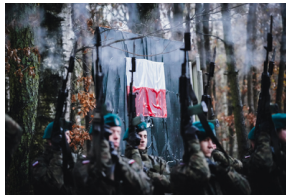
Uroczysty pogrzeb szczątków nieznanych z imienia i nazwiska żołnierzy Wojska Polskiego