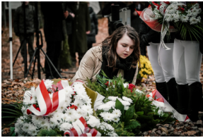
Uroczysty pogrzeb szczątków nieznanych z imienia i nazwiska żołnierzy Wojska Polskiego