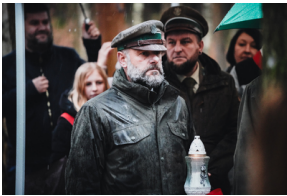
Uroczysty pogrzeb szczątków nieznanych z imienia i nazwiska żołnierzy Wojska Polskiego