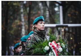
Uroczysty pogrzeb szczątków nieznanych z imienia i nazwiska żołnierzy Wojska Polskiego