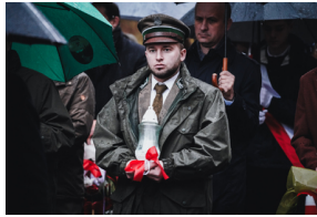
Uroczysty pogrzeb szczątków nieznanych z imienia i nazwiska żołnierzy Wojska Polskiego