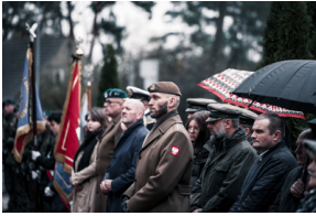
Uroczysty pogrzeb szczątków nieznanych z imienia i nazwiska żołnierzy Wojska Polskiego