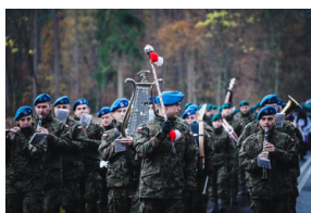
Uroczysty pogrzeb szczątków nieznanych z imienia i nazwiska żołnierzy Wojska Polskiego