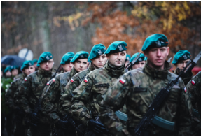
Uroczysty pogrzeb szczątków nieznanych z imienia i nazwiska żołnierzy Wojska Polskiego