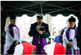
Uroczysty pogrzeb szczątków nieznanych z imienia i nazwiska żołnierzy Wojska Polskiego