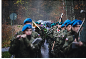
Uroczysty pogrzeb szczątków nieznanych z imienia i nazwiska żołnierzy Wojska Polskiego