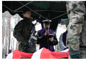
Uroczysty pogrzeb szczątków nieznanych z imienia i nazwiska żołnierzy Wojska Polskiego