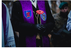
Uroczysty pogrzeb szczątków nieznanych z imienia i nazwiska żołnierzy Wojska Polskiego