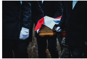
Uroczysty pogrzeb szczątków nieznanych z imienia i nazwiska żołnierzy Wojska Polskiego