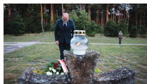
Upamiętnienie ofiar egzekucji w Puszczy Kampinoskiej