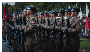
Upamiętnienie ofiar egzekucji w Puszczy Kampinoskiej