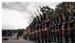
Upamiętnienie ofiar egzekucji w Puszczy Kampinoskiej