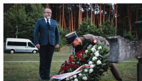
Upamiętnienie ofiar egzekucji w Puszczy Kampinoskiej