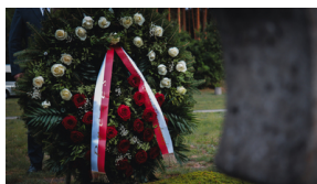
Upamiętnienie ofiar egzekucji w Puszczy Kampinoskiej