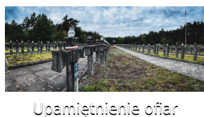
Upamiętnienie ofiar egzekucji w Puszczy Kampinoskiej