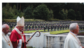
Upamiętnienie ofiar egzekucji w Puszczy Kampinoskiej