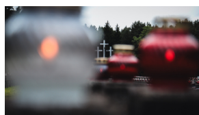
Upamiętnienie ofiar egzekucji w Puszczy Kampinoskiej