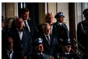
Rocznica otwarcia Polskiego Cmentarza Wojennego w Miednoje