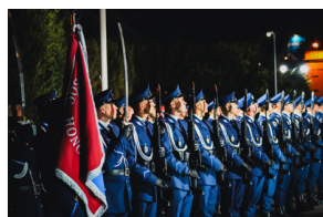
Rocznica otwarcia Polskiego Cmentarza Wojennego w Miednoje