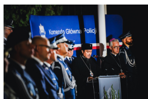
Rocznica otwarcia Polskiego Cmentarza Wojennego w Miednoje