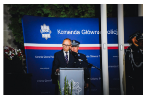
Rocznica otwarcia Polskiego Cmentarza Wojennego w Miednoje