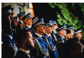
Rocznica otwarcia Polskiego Cmentarza Wojennego w Miednoje