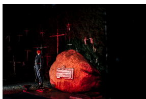
Rocznica otwarcia Polskiego Cmentarza Wojennego w Miednoje

Kulminacyjnym momentem obchodów był Apel Pamięci zakończony salwą honorową. Przedstawiciele władz państwowych, samorządowych i mundurowych oraz stowarzyszeń policyjnych złożyli wieńce i wiązanki przed pomnikiem znajdującym się w centralnym punkcie dziedzińca KGP.