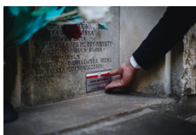
Dzień Weterana Walk o Niepodległość Rzeczypospolitej Polskiej