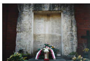
Dzień Weterana Walk o Niepodległość Rzeczypospolitej Polskiej