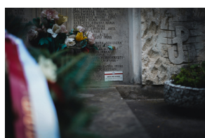
Dzień Weterana Walk o Niepodległość Rzeczypospolitej Polskiej