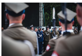
Dzień Weterana Walk o