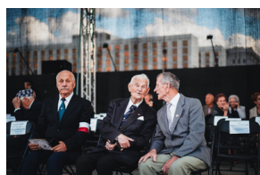
Dzień Weterana Walk o