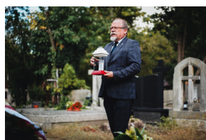
Dzień Weterana Walk o Niepodległość Rzeczypospolitej Polskiej