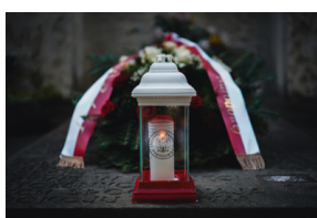
Dzień Weterana Walk o Niepodległość Rzeczypospolitej Polskiej

Biuro Upamiętniania Walk i Męczeństwa IPN zaangażowane jest m.in w kultywowanie pamięci o tych, którzy walczyli i cierpieli za niepodległą i suwerenną Polskę, a po wojnach wrócili do cywilnego życia, choć często na emigracji, z dala od najbliższych i umiłowanej Ojczyzny. Co roku udzielane są dotacje celowe oraz przyznawane świadczenia pieniężne na pokrycie kosztów sprawowania opieki nad grobami weteranów w myśl ustawy z dnia 22 listopada 2018 r. o grobach weteranów walk o wolność i niepodległość Polski.