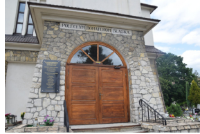
Spotkanie członków Komitetu Ochrony Pamięci Walk i Męczeństwa przy Oddziale IPN w Katowicach.