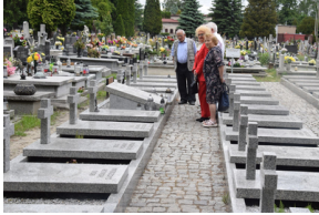
Spotkanie członków Komitetu Ochrony Pamięci Walk i Męczeństwa przy Oddziale IPN w Katowicach.