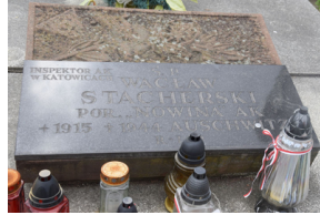
Spotkanie członków Komitetu Ochrony Pamięci Walk i Męczeństwa przy Oddziale IPN w Katowicach.