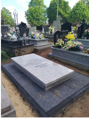
Grób weterana po remoncie