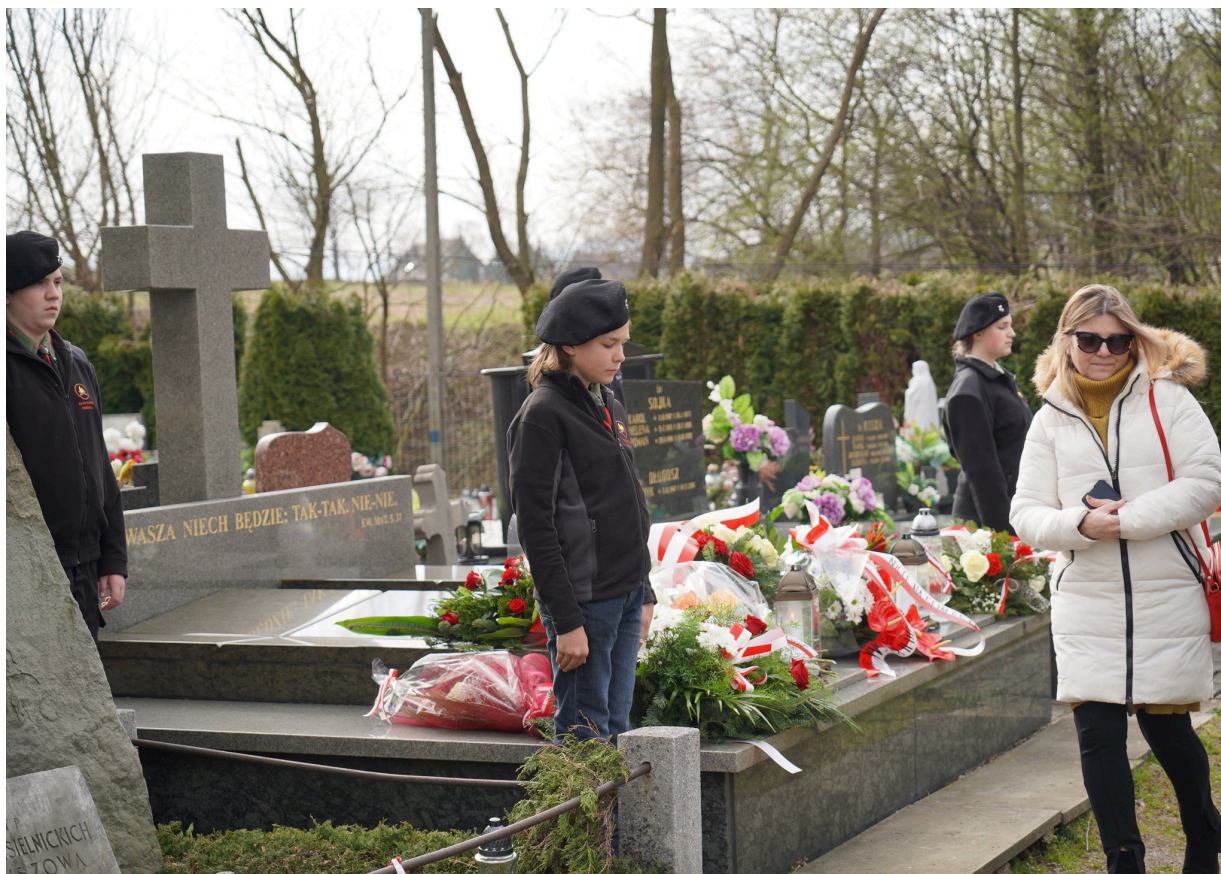
Uroczystość z okazji 55. rocznicy śmierci Zofii Kossak-Szatkowskiej, 5 kwietnia 2023 r. Górki Wielkie.