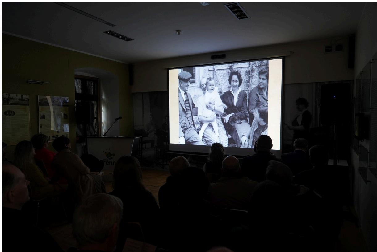
Uroczystość z okazji 55. rocznicy śmierci Zofii Kossak-Szatkowskiej. 5 kwietnia 2023 r. Górki Wielkie.