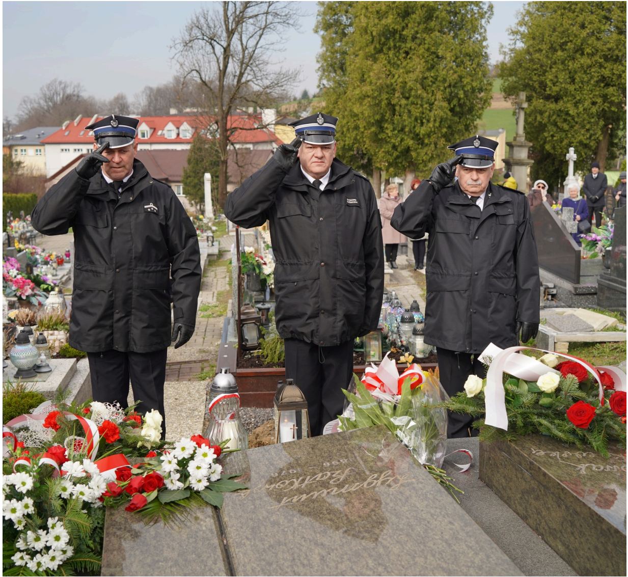
Uroczystość z okazji 55. rocznicy śmierci Zofii Kossak-Szatkowskiej. 5 kwietnia 2023 r. Górki Wielkie.