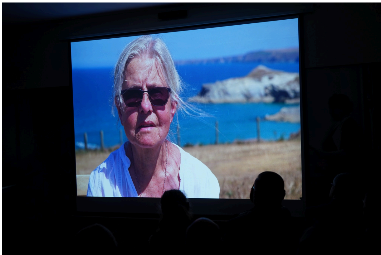
Uroczystość z okazji 55. rocznicy śmierci Zofii Kossak-Szatkowskiej. 5 kwietnia 2023 r. Górki Wielkie.