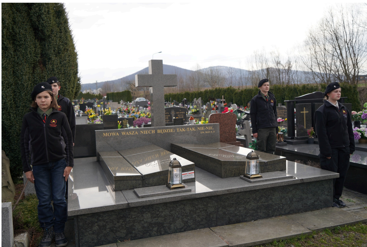
Uroczystość z okazji 55. rocznicy śmierci Zofii Kossak-Szatkowskiej. 5 kwietnia 2023 r. Górki Wielkie.