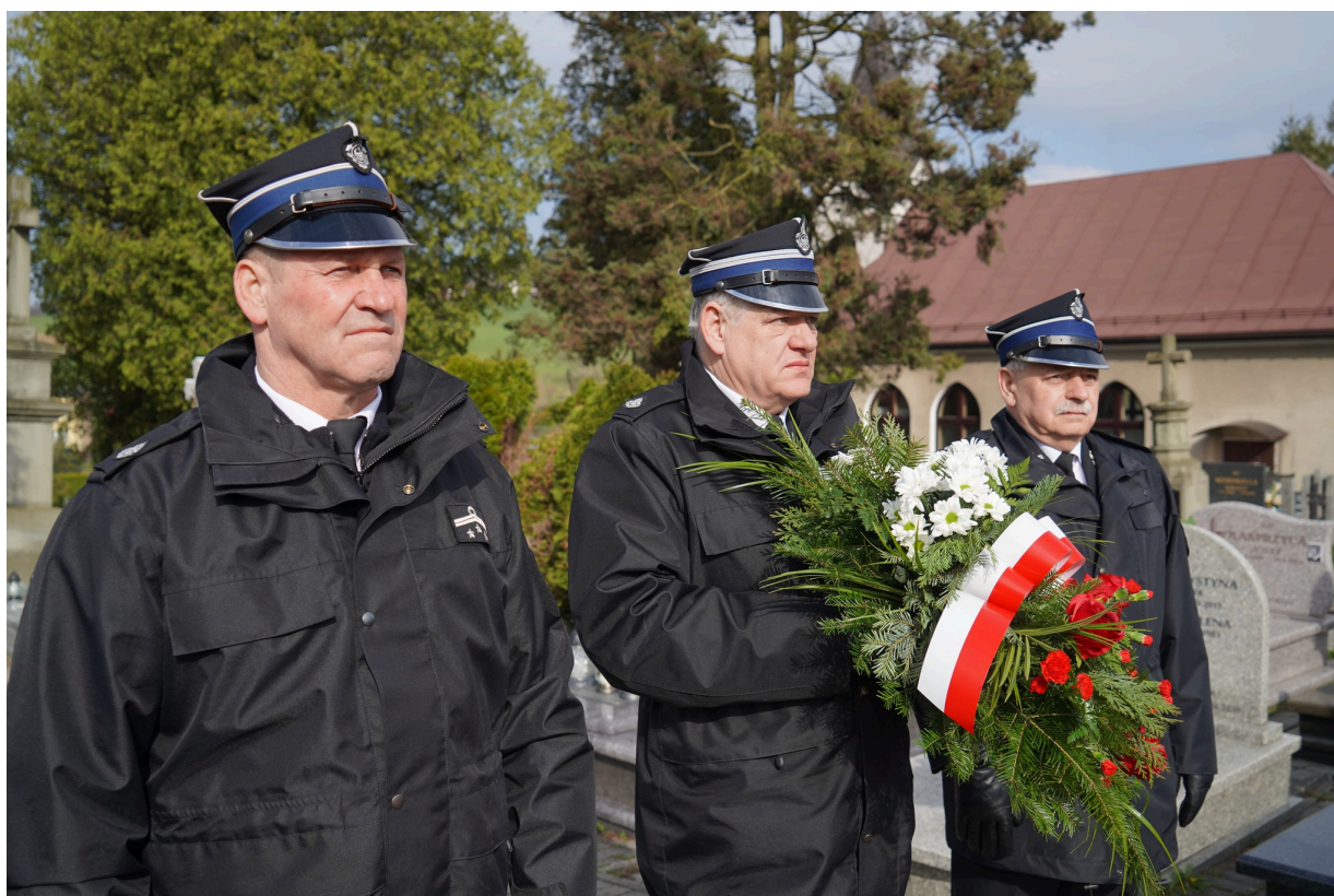
Uroczystość z okazji 55. rocznicy śmierci Zofii Kossak-Szatkowskiej, 5 kwietnia 2023 r. Górki Wielkie.