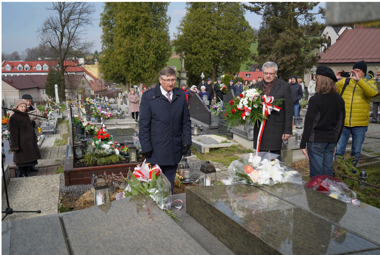
Uroczystość z okazji 55. rocznicy śmierci Zofii Kossak-Szatkowskiej. 5 kwietnia 2023 r. Górki Wielkie.