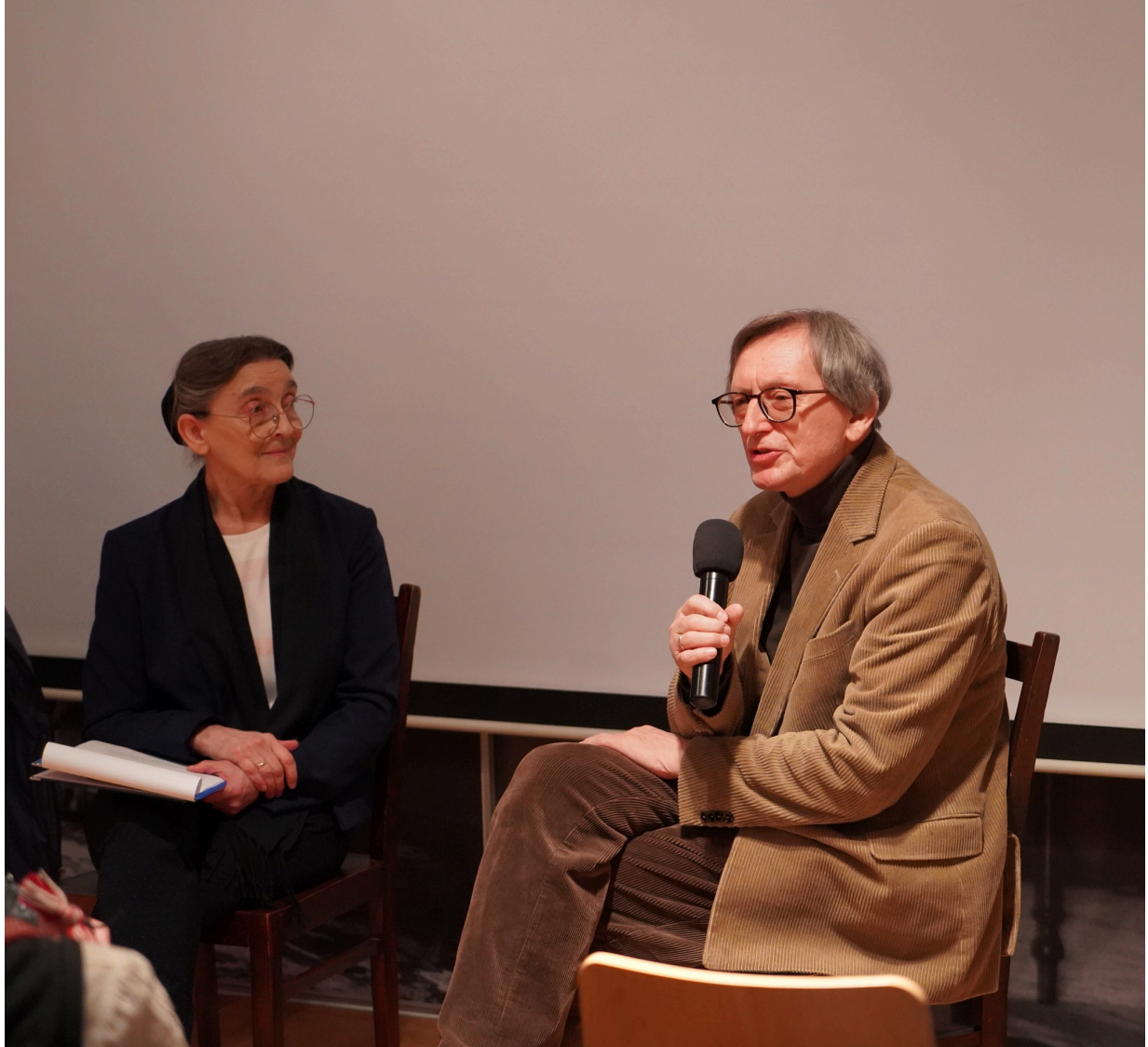
Uroczystość z okazji 55. rocznicy śmierci Zofii Kossak-Szatkowskiej, 5 kwietnia 2023 r. Górki Wielkie. Fot.: Łukasz Muschiol/OPKiS w Brennej

Górki Wielkie. Fot.: Łukasz Muschiol/OPKiS w Brennej