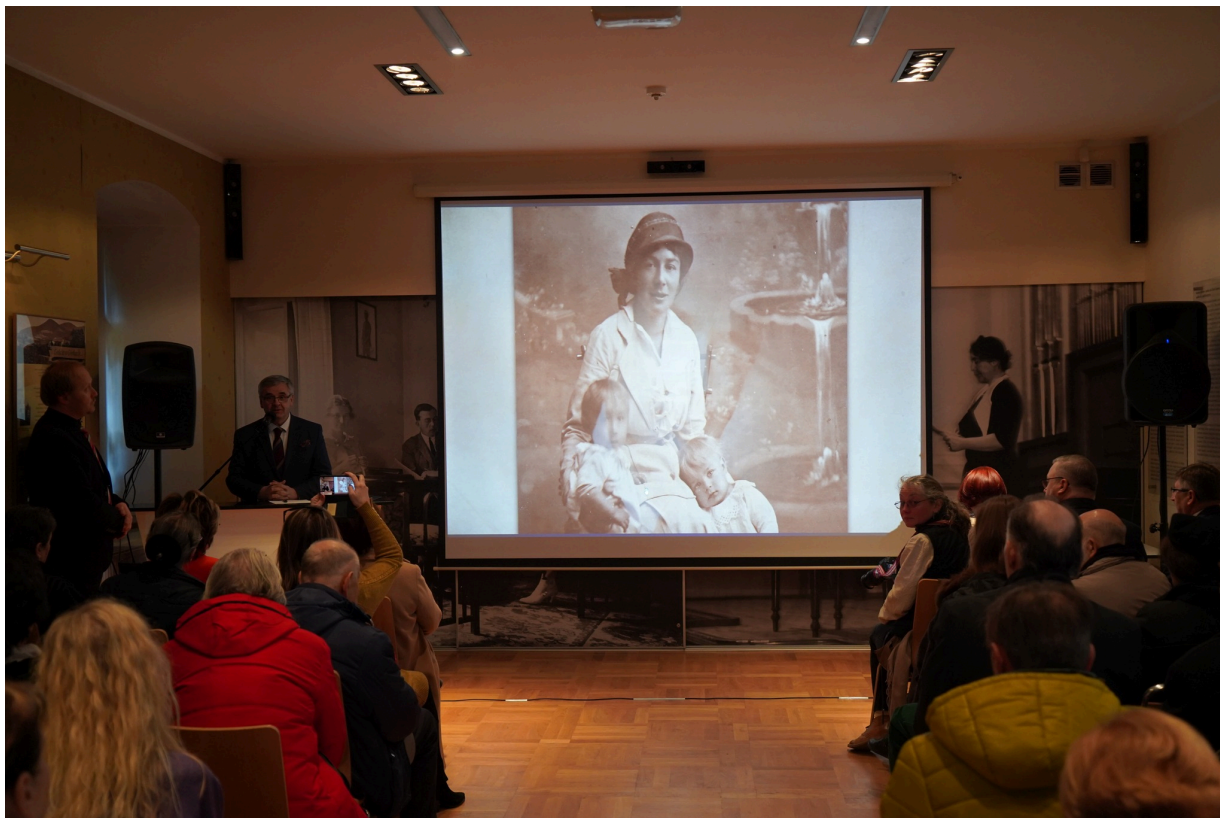
Uroczystość z okazji 55. rocznicy śmierci Zofii Kossak-Szatkowskiej. 5 kwietnia 2023 r. Górki Wielkie.