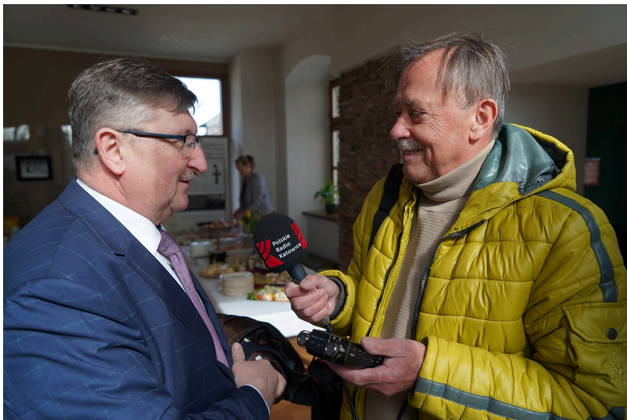
Uroczystość z okazji 55. rocznicy śmierci Zofii Kossak-Szatkowskiej. 5 kwietnia 2023 r. Górki Wielkie.