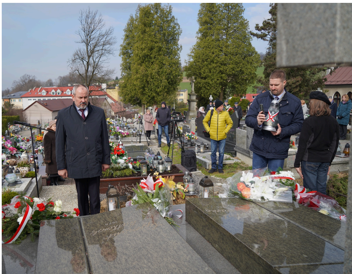
Uroczystość z okazji 55. rocznicy śmierci Zofii Kossak-Szatkowskiej. 5 kwietnia 2023 r.