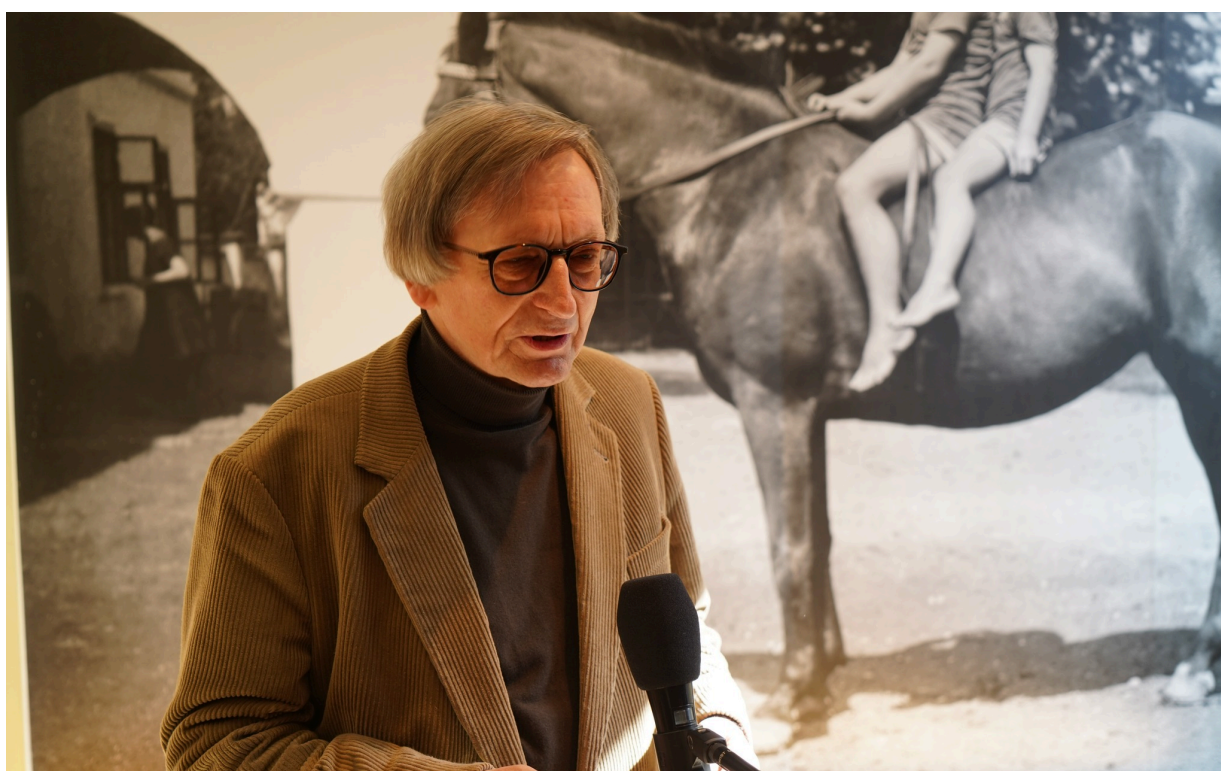
Uroczystość z okazji 55. rocznicy śmierci Zofii Kossak-Szatkowskiej. 5 kwietnia 2023 r. Górkach Wielkich.

5 kwietnia 2023 r. w Górkach Wielkich odbyła się uroczystość z okazji 55. rocznicy śmierci