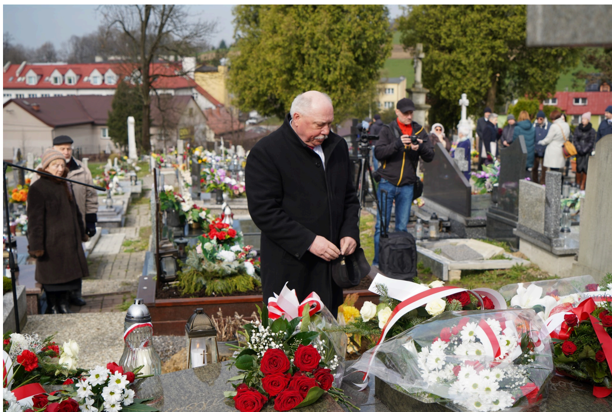
Uroczystość z okazji 55. rocznicy śmierci Zofii Kossak-Szatkovskiej. 5 kwietnia 2023 r. Górki Wielkie.