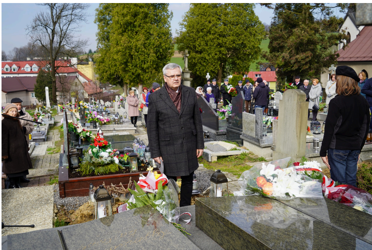
Uroczystość z okazji 55. rocznicy śmierci Zofii Kossak-Szatkowskiej. 5 kwietnia 2023 r. Górki Wielkie.