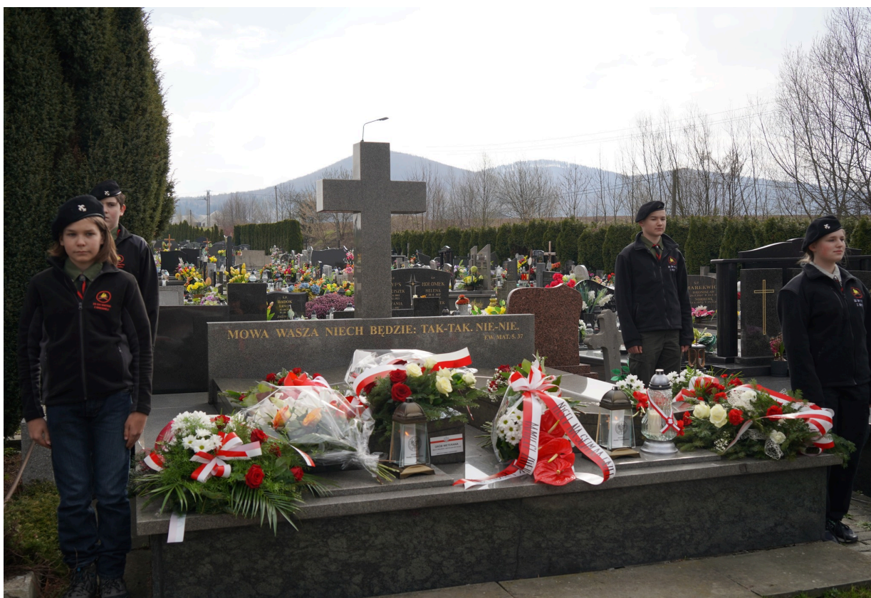
Uroczystość z okazji 55. rocznicy śmierci Zofii Kossak-Szatkowskiej. 5 kwietnia 2023 r. Górki Wielkie.