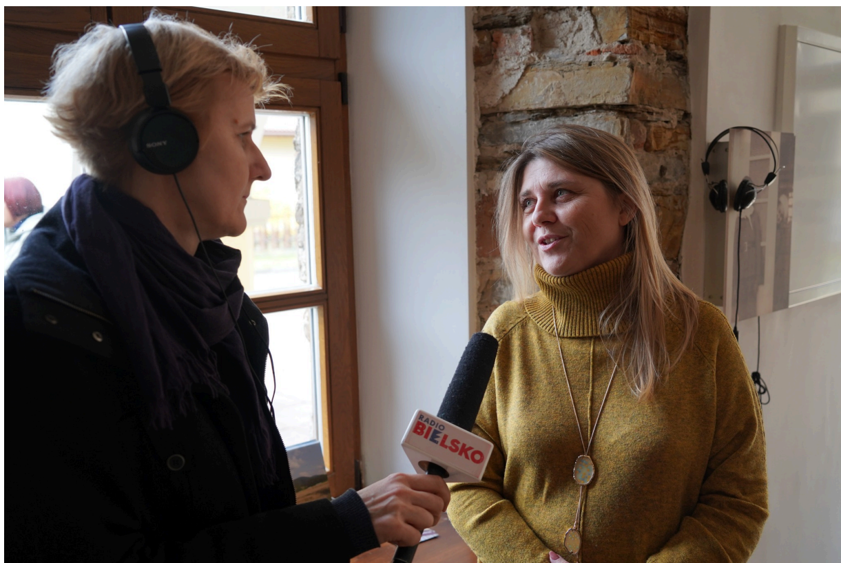
Uroczystość z okazji 55. rocznicy śmierci Zofii Kossak-Szatkowskiej. 5 kwietnia 2023 r. Górki Wielkie.