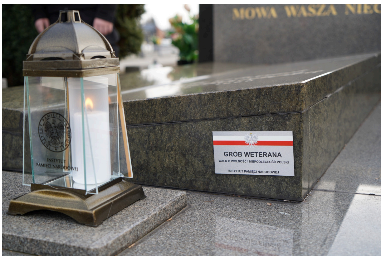
Uroczystość z okazji 55. rocznicy śmierci Zofii Kossak-Szatkowskiej. 5 kwietnia 2023 r. Górki Wielkie.