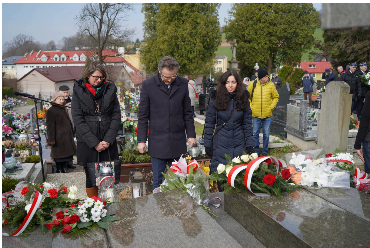
Uroczystość z okazji 55. rocznicy śmierci Zofii Kossak-Szatkowskiej. 5 kwietnia 2023 r.