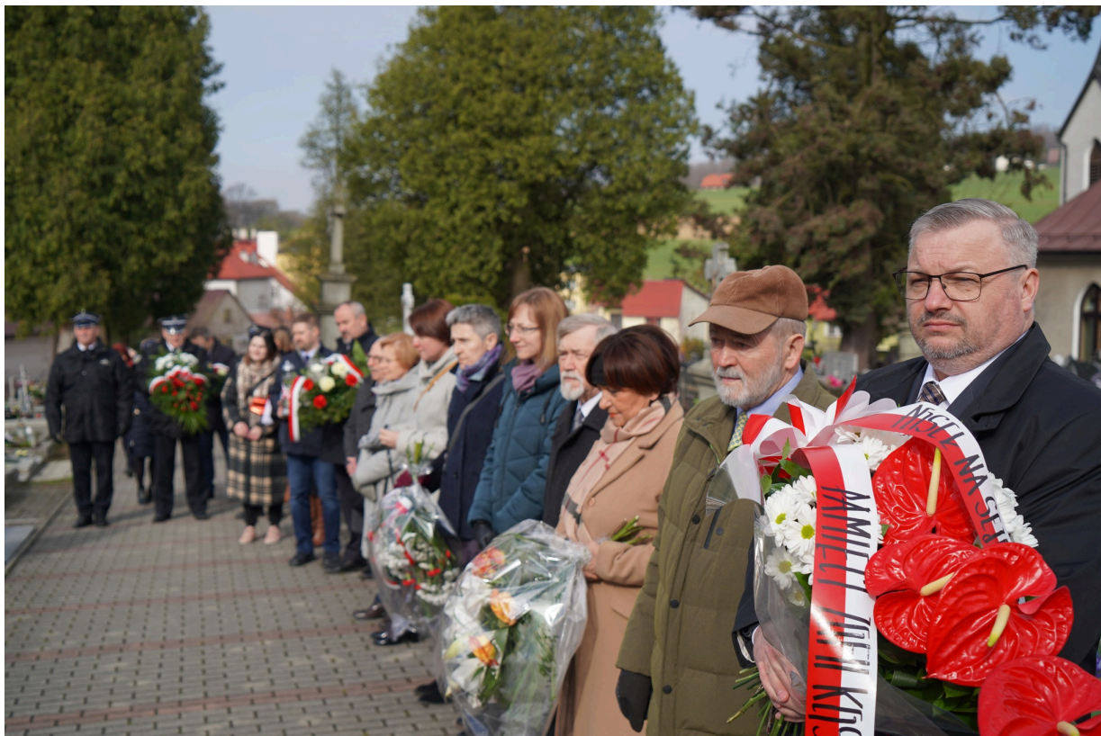
Uroczystość z okazji 55. rocznicy śmierci Zofii Kossak-Szatkowskiej. 5 kwietnia 2023 r. Górki Wielkie.