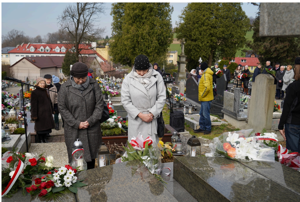
Uroczystość z okazji 55. rocznicy śmierci Zofii Kossak-Szatkowskiej. 5 kwietnia 2023 r. Górki Wielkie.