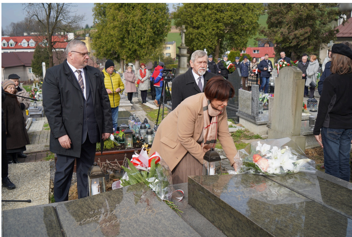
Uroczystość z okazji 55. rocznicy śmierci Zofii Kossak-Szatkowskiej. 5 kwietnia 2023 r. Górki Wielkie.