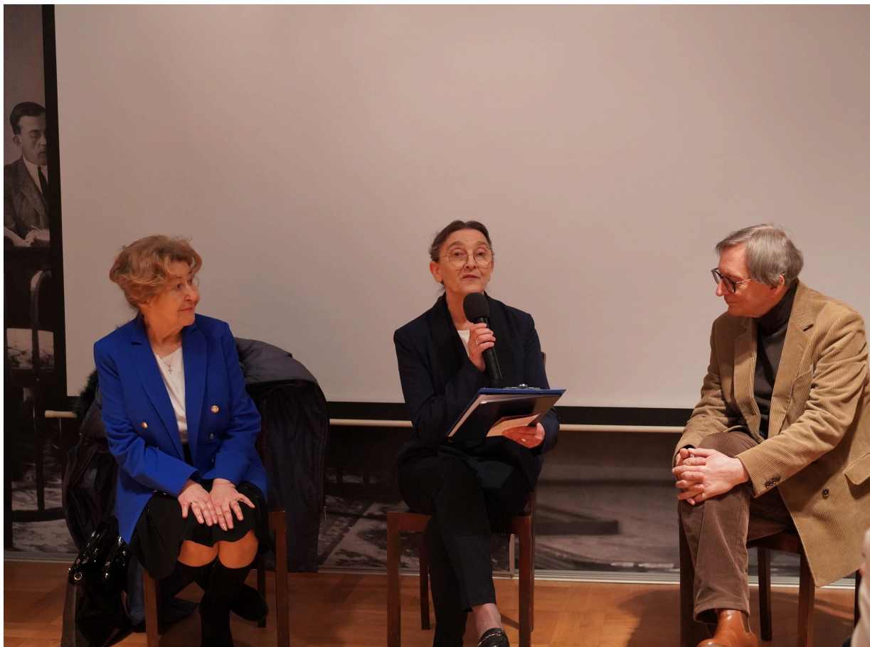
Uroczystość z okazji 55. rocznicy śmierci Zofii Kossak-Szatkowskiej. 5 kwietnia 2023 r. Górki Wielkie.