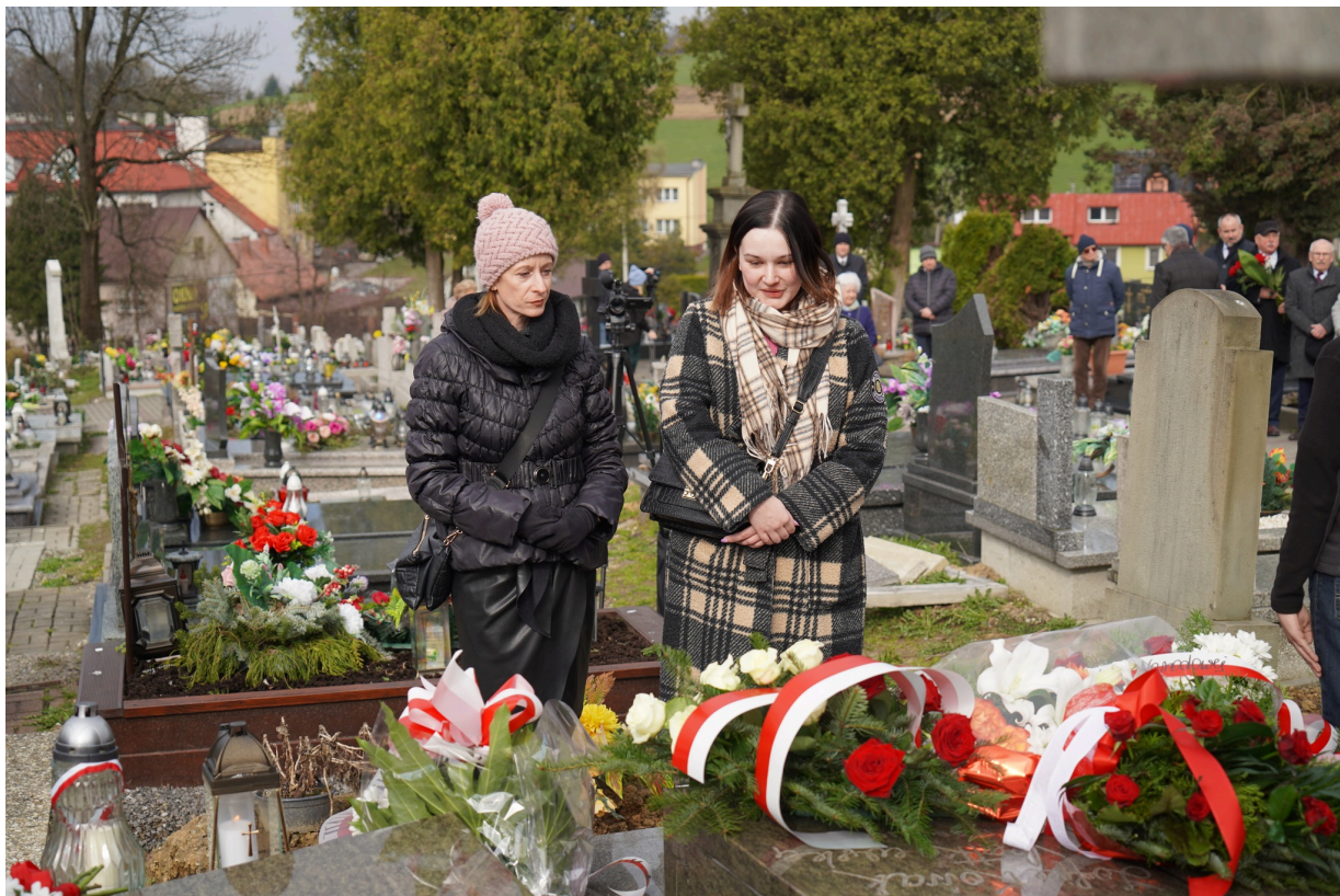
Uroczystość z okazji 55. rocznicy śmierci Zofii Kossak-Szatkowskiej. 5 kwietnia 2023 r. Górki Wielkie.