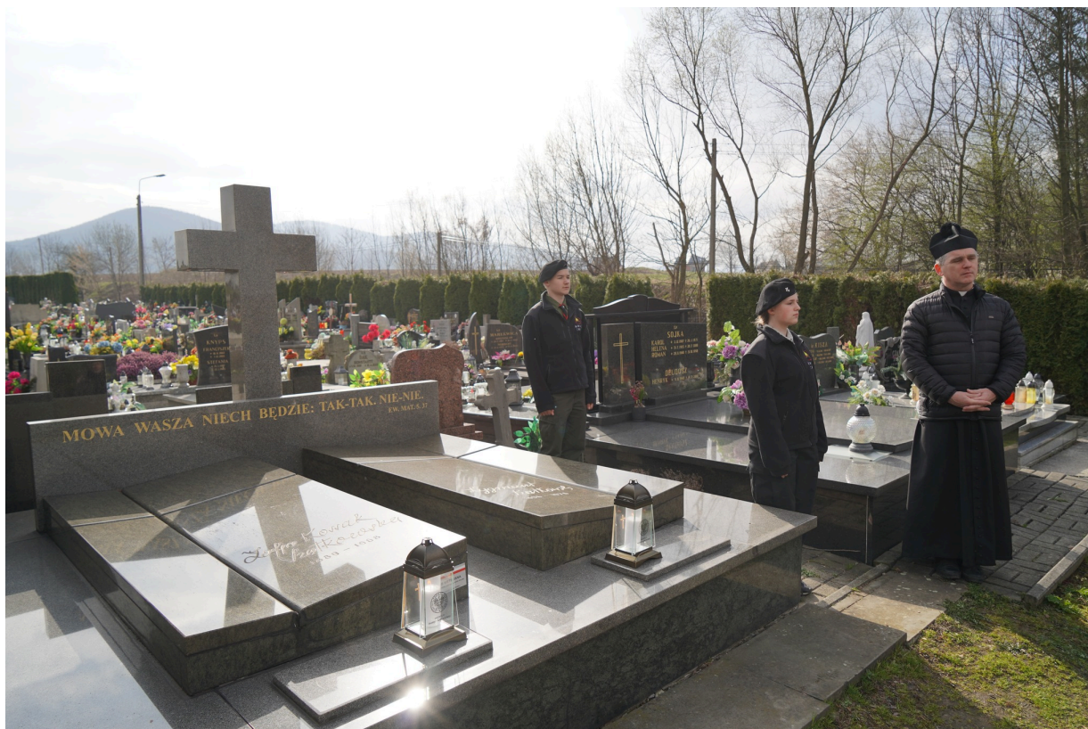
Uroczystość z okazji 55. rocznicy śmierci Zofii Kossak-Szatkowskiej. 5 kwietnia 2023 r. Górkach Wielkich.