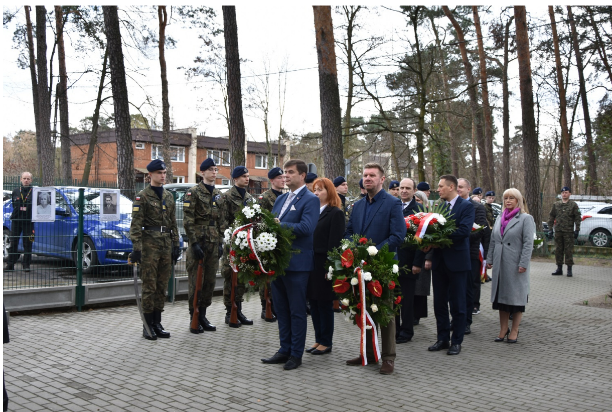
Uroczyste odsłonięcie tablicy upamiętniającej walkę i męczeństwo nauczycieli i pracowników Szkoły Podstawowej nr 5 w Otwocku w czasie II wojny światowej i otwarcie Sali 100-lecia im. Aleksandry i Józefa Piłsudskich - Otwock, 31 marca 2023.