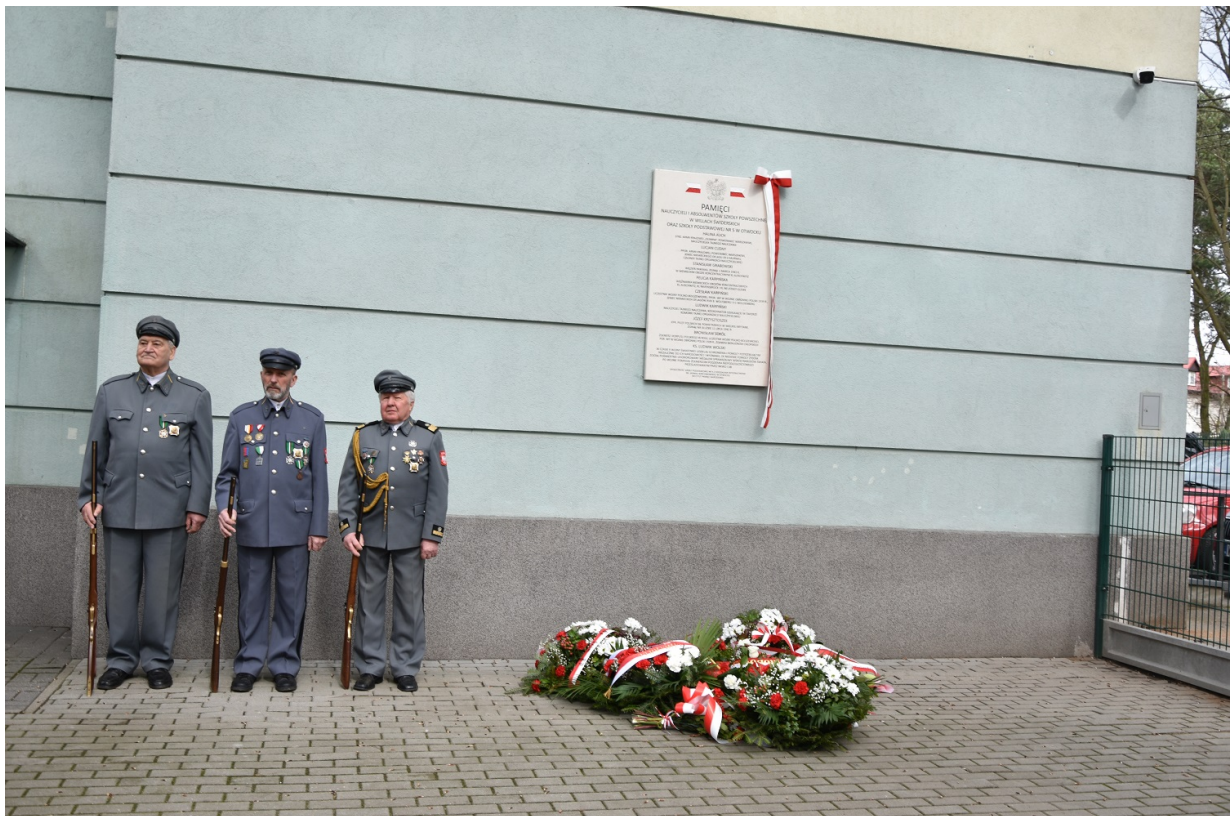
Uroczyste odsłonięcie tablicy upamiętniającej walkę i męczeństwo nauczycieli i