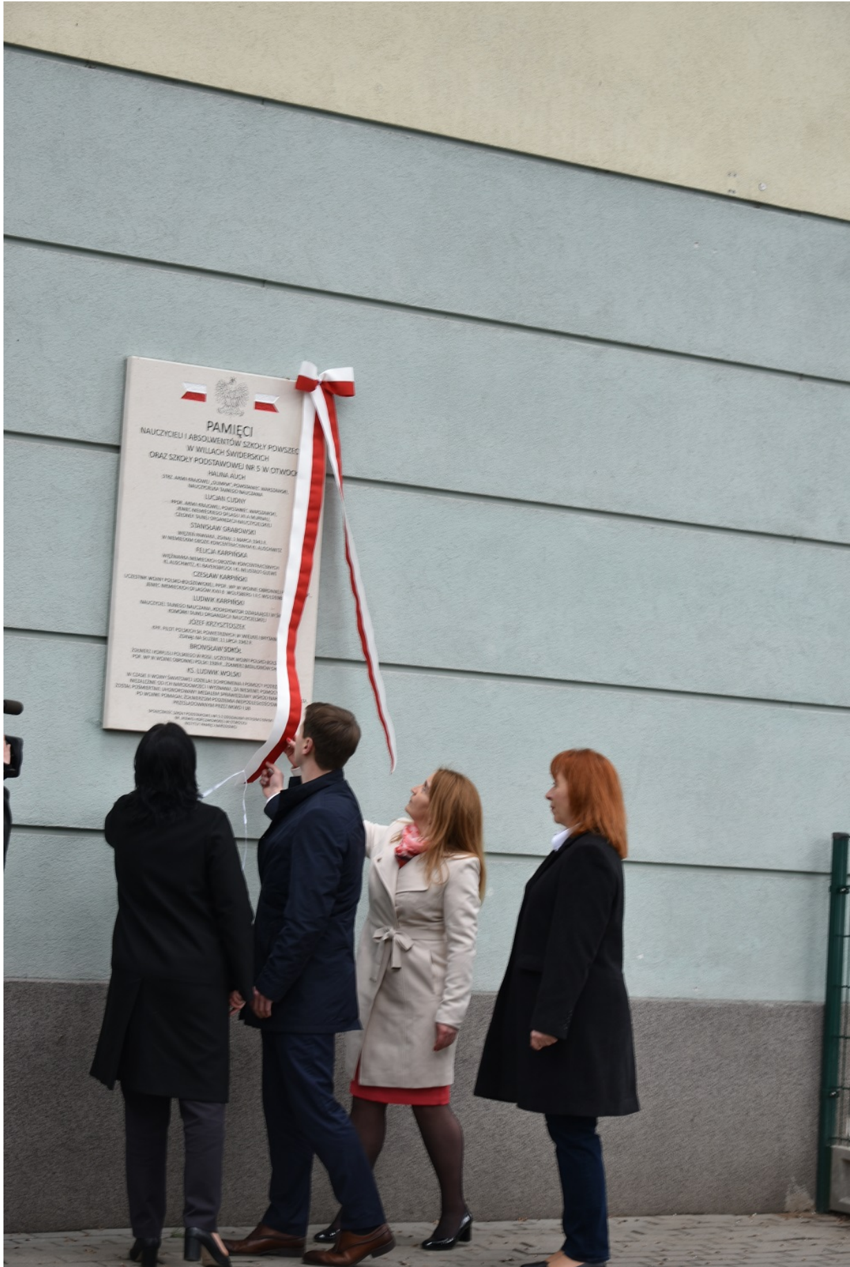
Uroczyste odsłonięcie tablicy upamiętniającej walkę i męczeństwo nauczycieli i