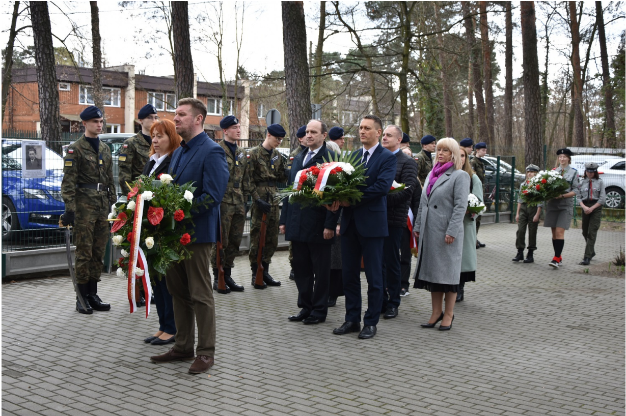
Uroczyste odsłonięcie tablicy upamiętniającej walkę i męczeństwo nauczycieli i pracowników Szkoły Podstawowej nr 5 w Otwocku w czasie II wojny światowej i otwarcie Sali 100-lecia im. Aleksandry i Józefa Piłsudskich - Otwock, 31 marca 2023.