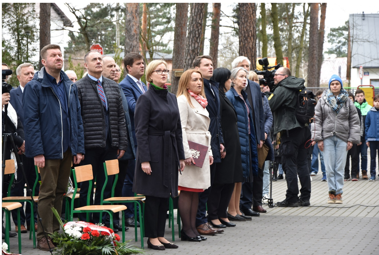
Uroczyste odsłonięcie tablicy upamiętniającej walkę i męczeństwo nauczycieli i pracowników Szkoły Podstawowej nr 5 w Otwocku w czasie II wojny światowej i otwarcie Sali 100-lecia im. Aleksandry i Józefa Piłsudskich - Otwock, 31 marca 2023.