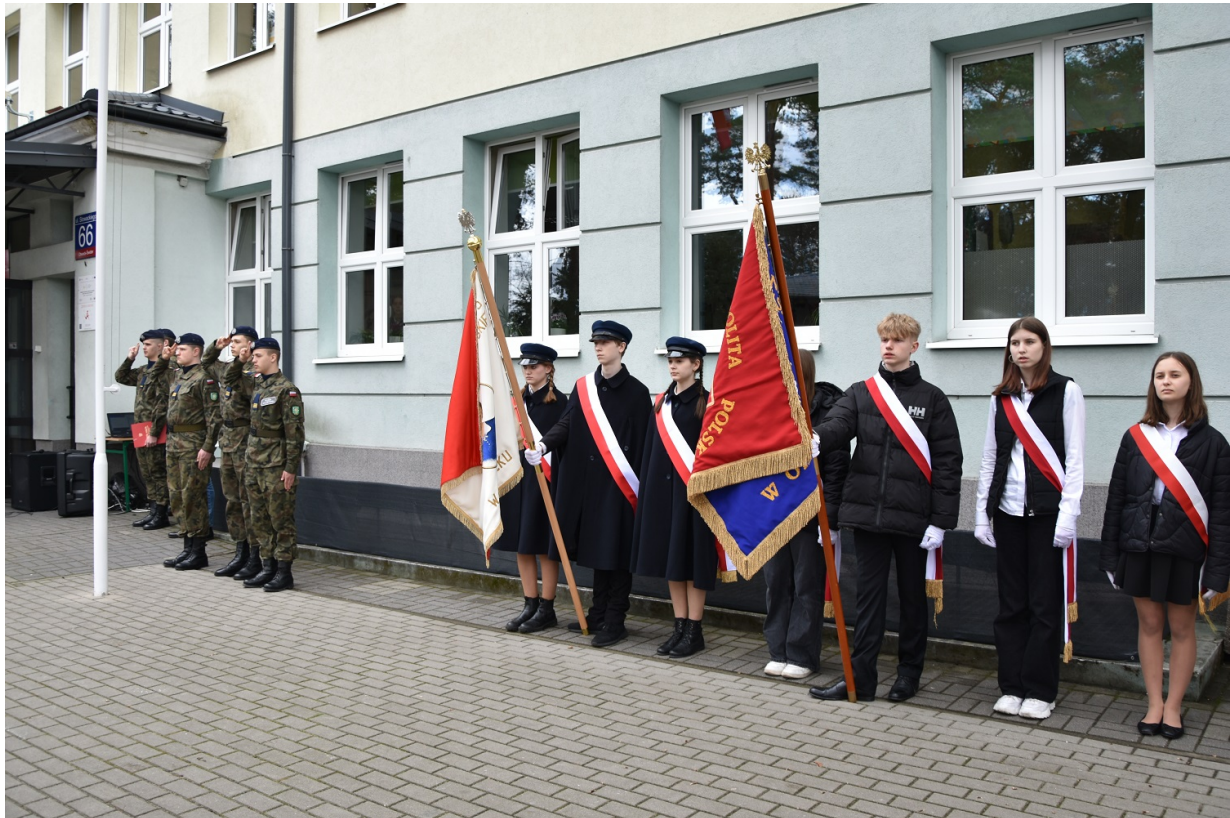
Uroczyste odsłonięcie tablicy upamiętniającej walkę i męczeństwo nauczycieli i pracowników Szkoły Podstawowej nr 5 w Otwocku w czasie II wojny światowej i otwarcie Sali 100-lecia im. Aleksandry i Józefa Piłsudskich - Otwock, 31 marca 2023.