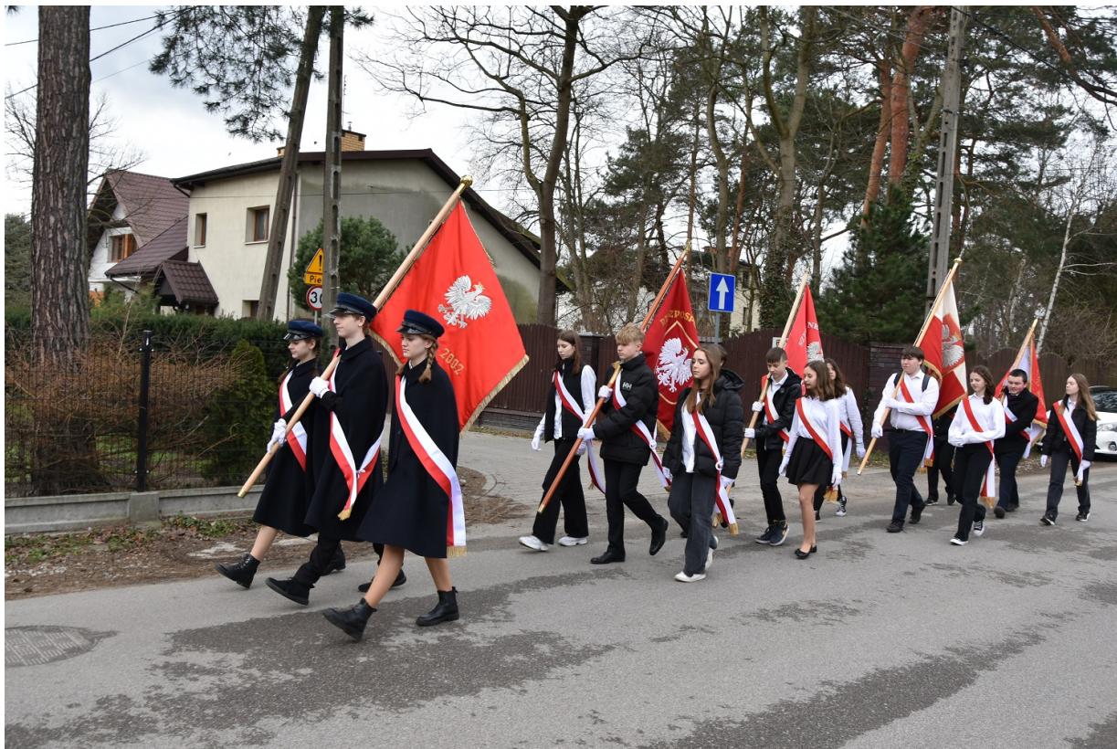
Uroczyste odsłonięcie tablicy upamiętniającej walkę i męczeństwo nauczycieli i pracowników Szkoły Podstawowej nr 5 w Otwocku w czasie II wojny światowej i otwarcie Sali 100-lecia im. Aleksandry i Józefa Piłsudskich - Otwock, 31 marca 2023.