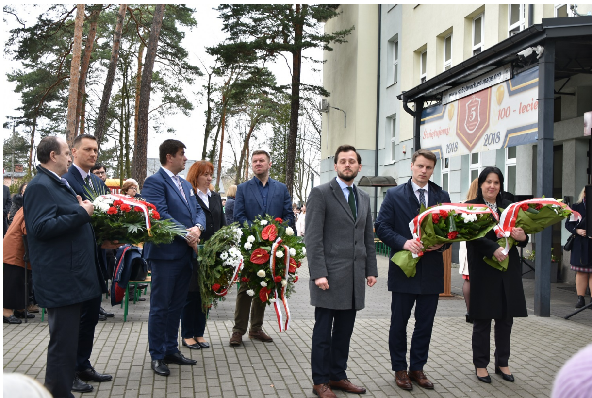
Uroczyste odsłonięcie tablicy upamiętniającej walkę i męczeństwo nauczycieli i pracowników Szkoły Podstawowej nr 5 w Otwocku w czasie II wojny światowej i otwarcie Sali 100-lecia im. Aleksandry i Józefa Piłsudskich - Otwock, 31 marca 2023.