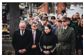
Ceremonia pogrzebowa trzech żołnierzy armii węgierskiej poległych w walkach z Armią Czerwoną