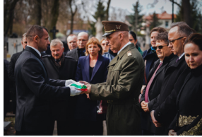
Ceremonia pogrzebowa trzech żołnierzy armii węgierskiej poległych w walkach z Armią Czerwoną