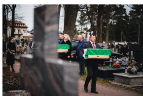
Ceremonia pogrzebowa trzech żołnierzy armii węgierskiej poległych w walkach z Armią Czerwoną