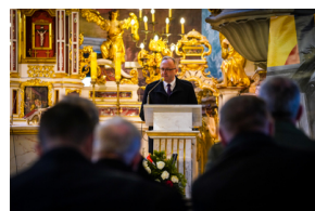
Ceremonia pogrzebowa trzech żołnierzy armii węgierskiej poległych w walkach z Armią Czerwoną