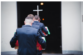
Ceremonia pogrzebowa trzech żołnierzy armii węgierskiej poległych w walkach z Armią Czerwoną

23 marca 2023 r. w Bazylice św. Trójcy w Kobylce, msza święta zainaugurowała ceremonię pogrzebową trzech żołnierzy armii węgierskiej, poległych w walkach z Armią Czerwoną w 1944 r.