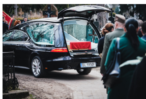
Ceremonia pogrzebowa trzech żołnierzy armii węgierskiej poległych w walkach z Armią Czerwoną