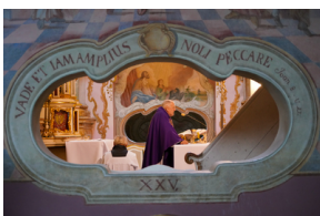
Ceremonia pogrzebowa trzech żołnierzy armii węgierskiej poległych w walkach z Armią Czerwoną