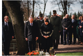
Ceremonia pogrzebowa trzech żołnierzy armii węgierskiej poległych w walkach z Armią Czerwoną