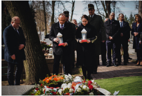
Ceremonia pogrzebowa trzech żołnierzy armii węgierskiej poległych w walkach z Armią Czerwoną