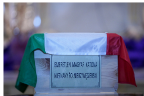
Ceremonia pogrzebowa trzech żołnierzy armii węgierskiej poległych w walkach z Armią Czerwoną