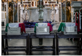
Ceremonia pogrzebowa trzech żołnierzy armii węgierskiej poległych w walkach z Armią Czerwoną