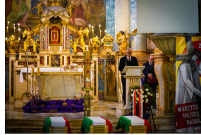
Ceremonia pogrzebowa trzech żołnierzy armii węgierskiej poległych w walkach z Armią Czerwoną