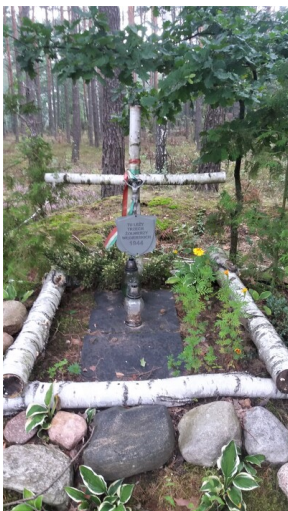
Miejsce ekshumacji 3 żołnierzy armii węgierskiej