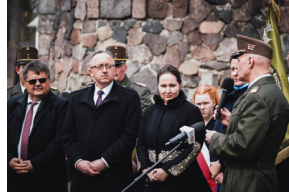
Ceremonia pogrzebowa trzech żołnierzy armii węgierskiej poległych w walkach z Armią Czerwoną