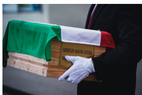
Ceremonia pogrzebowa trzech żołnierzy armii węgierskiej poległych w walkach z Armią Czerwoną

Na cmentarzu parafialnym żołnierze spoczęli w grobie wojennym. Biuro Upamiętniania Walk i Męczeństwa IPN sfinansował ekshumację i wymurowanie grobu, zaś strona węgierska ufundowała tablicę epitafijną.