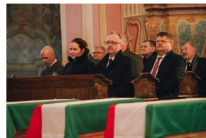
Ceremonia pogrzebowa trzech żołnierzy armii węgierskiej poległych w walkach z Armią Czerwoną