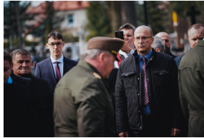
Ceremonia pogrzebowa trzech żołnierzy armii węgierskiej poległych w walkach z Armią Czerwoną