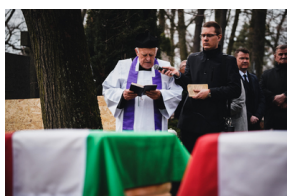
Ceremonia pogrzebowa trzech żołnierzy armii węgierskiej poległych w walkach z Armią Czerwoną