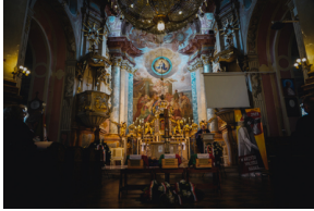
Ceremonia pogrzebowa trzech żołnierzy armii węgierskiej poległych w walkach z Armią Czerwoną