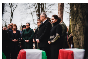
Ceremonia pogrzebowa trzech żołnierzy armii węgierskiej poległych w walkach z Armią Czerwoną