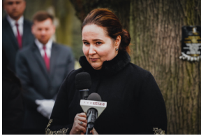
Ceremonia pogrzebowa trzech żołnierzy armii węgierskiej poległych w walkach z Armią Czerwoną