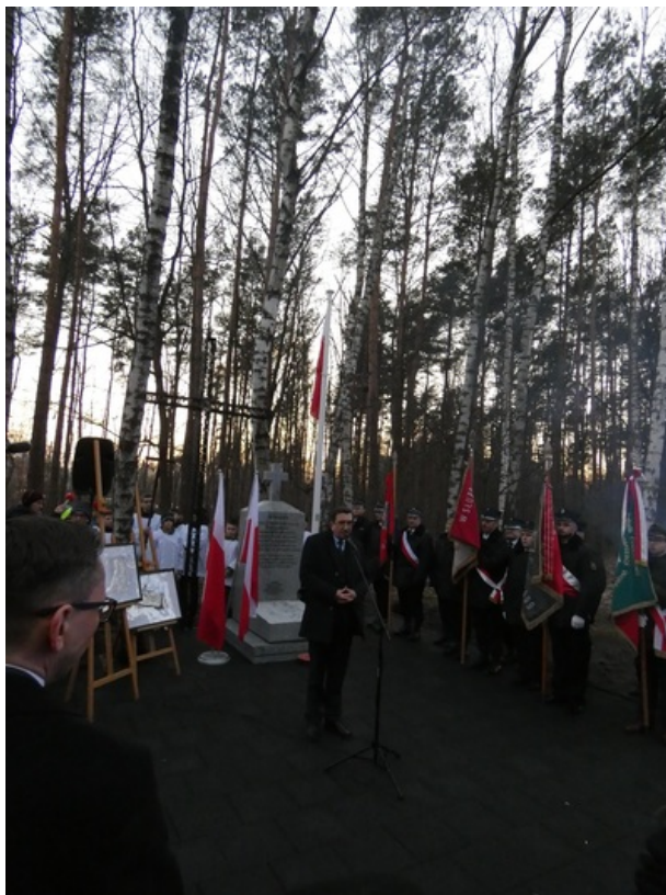
Uroczystość odsłonięcia upamiętnienia więźniów obozu przejściowego NKWD w Ostrówku - Ostrówek (gm. Klębów pow. Wołomin), 1 marca 2023

Informacja została przygotowana na podstawie: