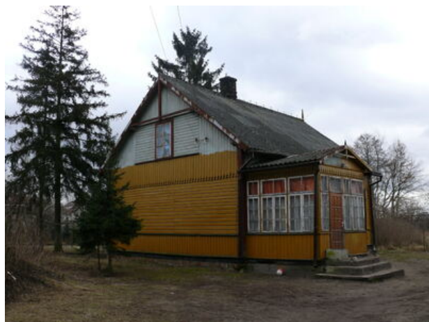
Willi Niedzielskiego 4, gdzie kwaterowało dowództwo obozu przejściowego NKWD