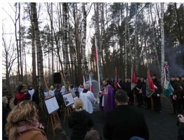
Uroczystość odsłonięcia upamiętnienia więźniów obozu przejściowego NKWD w Ostrówku - Ostrówek (gm. Klembów pow. Wołomin), 1 marca 2023