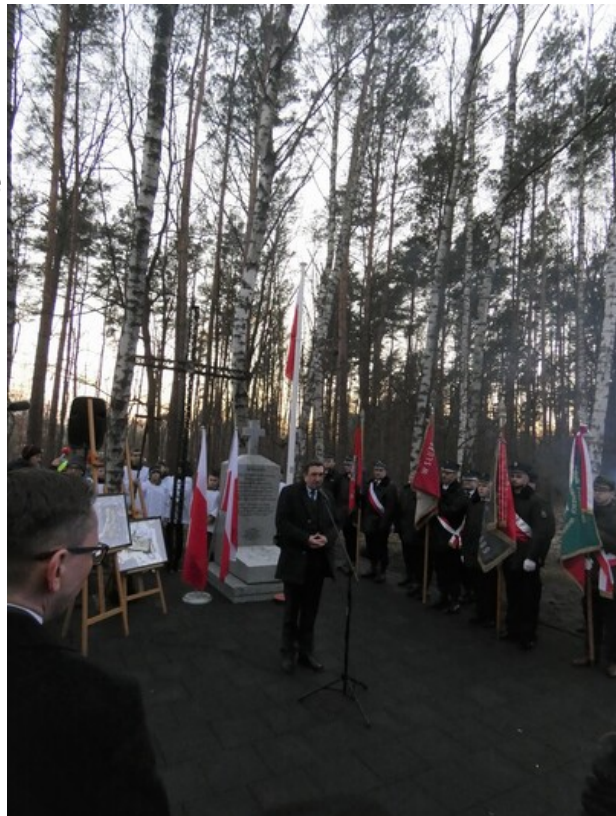
Uroczystość odsłonięcia upamiętnienia więźniów obozu przejściowego NKWD w Ostrówku - Ostrówek (gm. Klembów pow. Wołomin), 1 marca 2023

„Miałam wtedy 10 lat. W naszym domu było NKWD, słyszałam, jak przesłuchiwali, przyprawiali całą noc ludzi. Był taki okres, kiedy ja z moją siostrą i mamą spałyśmy na schodach, mama nas otulała pierzyną, a NKWD całą noc przyprawiało ludzi. Słyszałam strzępy przesłuchań : „A ty robił, a ty mówił..”. I tak w kółko... Potem niektórych wsadzali do piwnicy w naszym domu. Pod podłogą była mała piwniczka, gdzie mama trzymała ziemniaki i ci przetrzymywani siedzieli na ziemniakach. Było im tam niewygodnie, musieli siedzieć w kucki. Krzyków i bicia nie pamiętam. To była zima 1944/45. A w obozie obok, trzymano ludzi w ziemniakach, które były częściowo w ziemi z okrągłaków zrobione, były tam też prycze drewniane. Wiem to stąd, że po likwidacji obozu zostało to wszystko, a my - jak to dzieciaki - biegaliśmy po tym. Te ziemniaki to był taki prostokątny dół wykopany wzdłuż w ziemi i nakryty okrągłakami, a w środku zbite z balików były prycze i gdzieś gdzieś była rzucona garstka słomy. Tych dołów było kilka. Cały obóz był otoczony drutem kolczastym i wokoło stali strażnicy. Wejście było od strony obecnej ul. Leśnej i od tej strony nie można było postronnym podchodzić, tylko trzeba było iść drugą stroną ulicy. Obóz został zlikwidowany, jak