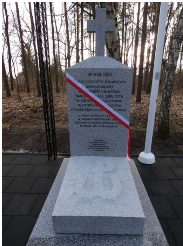
Uroczystość odsłonięcia upamiętnienia więźniów obozu przejściowego NKWD w Ostrówku - Ostrówek (gm. Klembów pow. Wołomin), 1 marca 2023