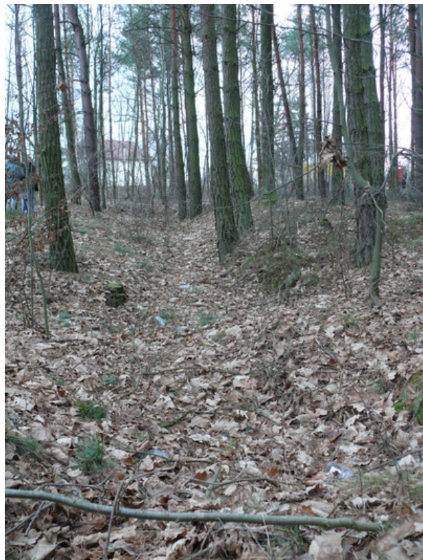
Ślady po ziemiankach obozu przejściowego NKWD - stan obecny