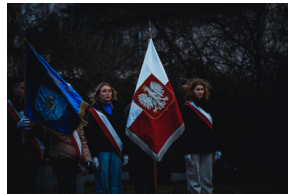
Uroczystości na symbolicznym Cmentarzu – Pomniku Zbrodni Wawerskiej przy ul. 27 Grudnia