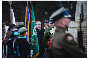
Uroczystości na symbolicznym Cmentarzu – Pomniku Zbrodni Wawerskiej przy ul. 27 Grudnia