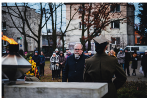
Uroczystości na symbolicznym Cmentarzu – Pomniku Zbrodni Wawerskiej przy ul. 27 Grudnia