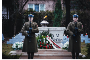
Uroczystości na symbolicznym Cmentarzu – Pomniku Zbrodni Wawerskiej przy ul. 27 Grudnia