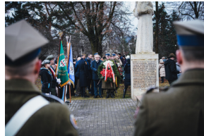
Uroczystości na symbolicznym Cmentarzu – Pomniku Zbrodni Wawerskiej przy ul. 27 Grudnia