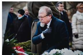
Uroczystości na symbolicznym Cmentarzu – Pomniku Zbrodni Wawerskiej przy ul. 27 Grudnia