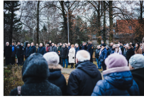
Uroczystości na symbolicznym Cmentarzu – Pomniku Zbrodni Wawerskiej przy ul. 27 Grudnia