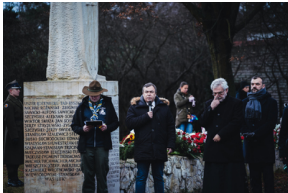
Uroczystości na symbolicznym Cmentarzu – Pomniku Zbrodni Wawerskiej przy ul. 27 Grudnia