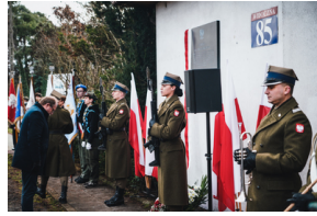
Uroczystość odsłonięcia tablicy przy ul. Widocznej 85 w Warszawie