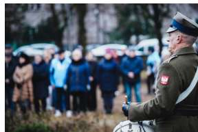
Uroczystości na symbolicznym Cmentarzu – Pomniku Zbrodni Wawerskiej przy ul. 27 Grudnia