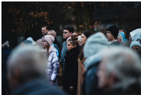
Uroczystości na symbolicznym Cmentarzu – Pomniku Zbrodni Wawerskiej przy ul. 27 Grudnia