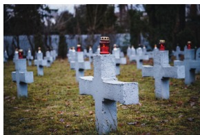
Uroczystości na symbolicznym Cmentarzu – Pomniku Zbrodni Wawerskiej przy ul. 27 Grudnia