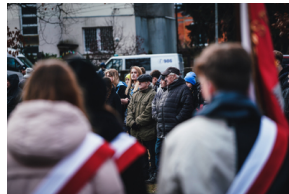
Uroczystości na symbolicznym Cmentarzu – Pomniku Zbrodni Wawerskiej przy ul. 27 Grudnia