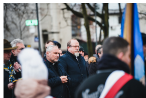
Uroczystości na symbolicznym Cmentarzu – Pomniku Zbrodni Wawerskiej przy ul. 27 Grudnia