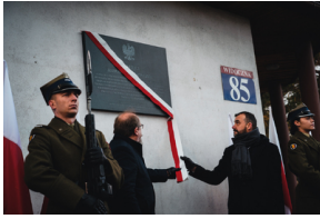
Uroczystość odsłonięcia tablicy przy ul. Widocznej 85 w Warszawie