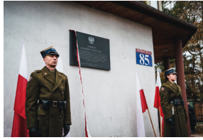
Uroczystość odsłonięcia tablicy przy ul. Widocznej 85 w Warszawie

Uroczystość zorganizowana została przez Radę i Zarząd Dzielnicy Wawer.