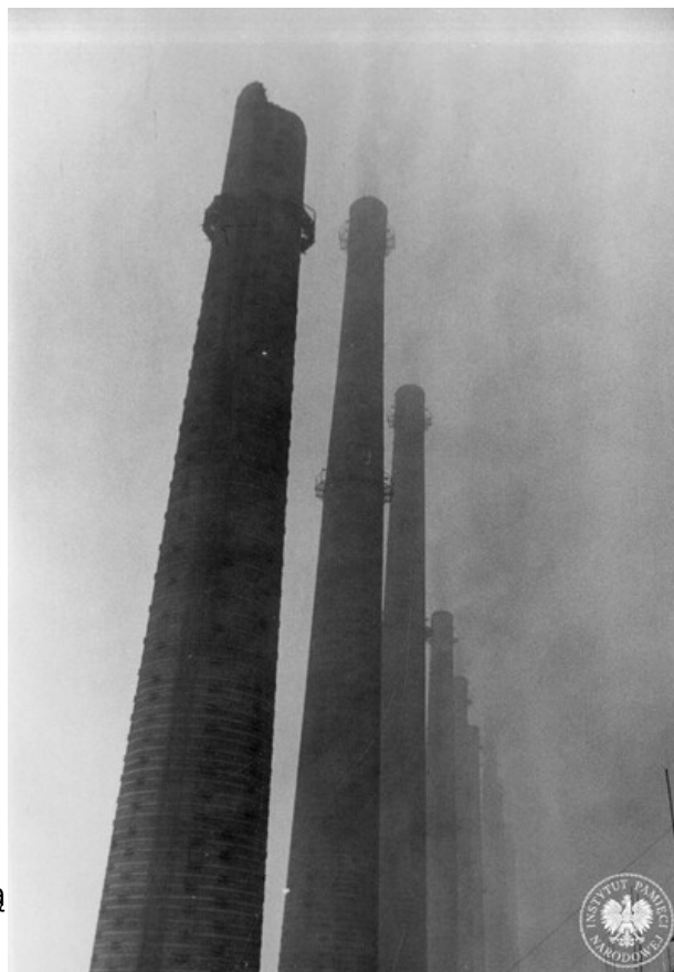
Kominy pieców martenowskich Huty Im. Lenina w Krakowie

Na początku 1949 r. sowieccy inżynierowie wybrali na realizację projektu budowy potężnej huty tereny wsi Pleszów i Mogiła na wschód od Krakowa. Obok kombinatu miało powstać wzorcowe, socjalistyczne, stutysięczne miasto. Miało być nowoczesne, piękne i wygodne. I miało przyćmić starą, królewską stolicę. Utopijne plany wkrótce zderzyły się z komunistyczną rzeczywistością. System nie podołał wyzwaniu, zamiast „szklanych domów” powstały szare blokowiska, spełniające wyłącznie rolę sypialni dla robotników. Budowa miasta i kombinatu była także wielką akcją propagandową, przedstawiającą ogromne, komunistyczne przedsięwzięcie jako sukces gospodarki planowej i rezultat niewzruszonej przyjaźni ze Związkiem