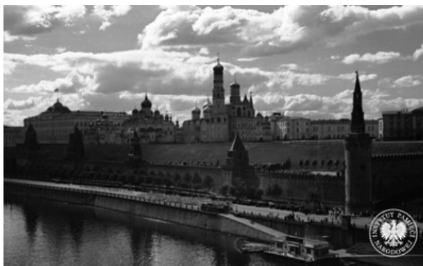
Widok na Kreml.

Traktat pokojowy, kończący wojnę polsko-bolszewicką, został zawarty w dwóch etapach. 12 października 1920 r. podpisano preliminaria pokojowe, których następstwem było zakończenie walk na froncie, a następnie po żmudnych i niełatwych rokowaniach 18 marca 1921 r. podpisano traktat ostateczny. Zawarto w nim zapisy m.in. o przebiegu linii granicznej między Polską a Rosją Sowiecką, wzajemnym poszanowaniu swojej suwerenności państwowej,