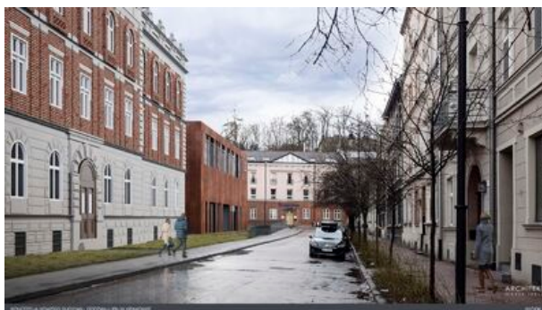
Wizualizacja nowej siedziby Oddziału IPN w Krakowie