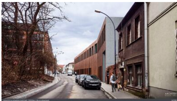
Wizualizacja nowej siedziby Oddziału IPN w Krakowie