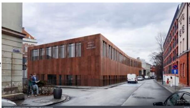
Wizualizacja nowej siedziby Oddziału IPN w Krakowie

Od ponad 20 lat kierownictwo Oddziału IPN w Krakowie dąży do połączenia całej instytucji w jednej lokalizacji. Jest to uzasadnione merytorycznie, funkcjonalnie i finansowo. Obniży wydatki związane z działalnością oddziału, generowane dotąd przez konieczność wynajmowania lokali na zasadach komercyjnych oraz koszty transportu i bieżącej komunikacji między