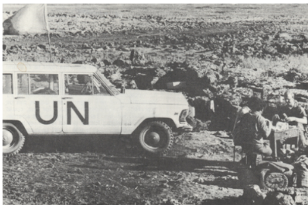
Punkt kontrolny wojsk Narodów Zjednoczonych.

Izrael został zaatakowany 6 października 1973 r. przez wojska Egiptu i Syrii. Atakujący uzyskali efekt zaskoczenia, gdyż uderzyli w dniu święta Jom Kipur. Po zawieszeniu konfliktu 25 października 1973 r. ONZ zdecydowała o utworzeniu Drugich Doraźnych Sił Zbrojnych NZ (Second United Nations Force - UNEF II), mających za zadanie rozdzielenie wojsk egipskich i izraelskich oraz nadzorowanie zawieszenia broni.