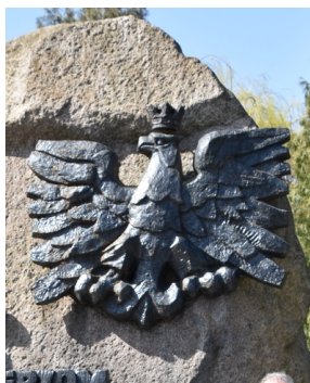
Orzeł po zamontowaniu korony