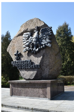
Pomnik po montażu korony