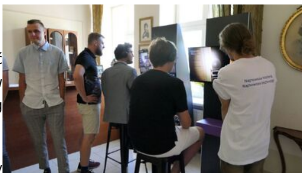
XVII Letnia Szkoła Historii Najnowszej IPN - 4-9 września 2023 r.