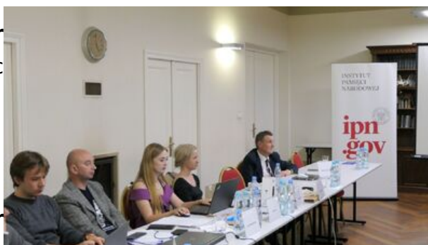
XVII Letnia Szkoła Historii Najnowszej IPN – 4-9 września 2023 r.

4. Konrad Rokicki: Obraz Polski i Polaków na łamach gazety „Prawda Wileńska” (1940-1941, 1944-1948)