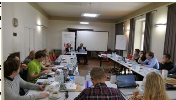
XVII Letnia Szkoła Historii Najnowszej IPN – 4-9 września 2023 r.