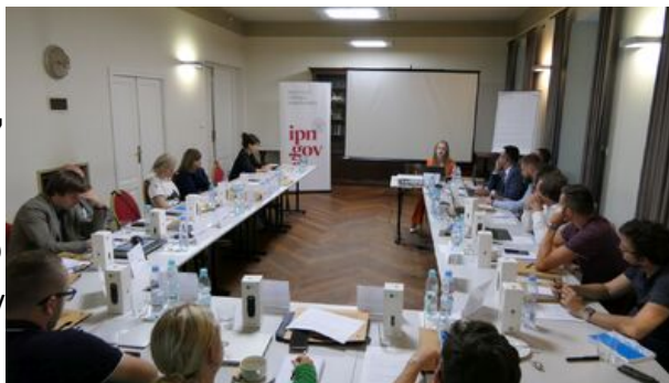
XVII Letnia Szkoła Historii Najnowszej IPN - 4-9 września 2023 r.