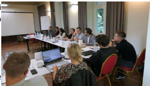
XVII Letnia Szkoła Historii Najnowszej IPN – 4-9 września 2023 r.