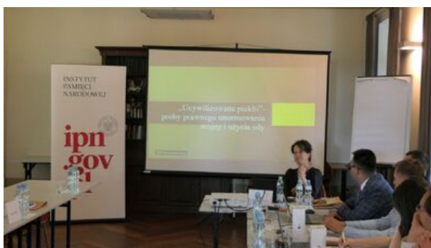
XVII Letnia Szkoła Historii Najnowszej IPN - 4-9 września 2023 r.