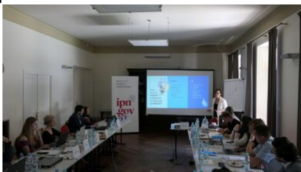
XVII Letnia Szkoła Historii Najnowszej IPN - 4-9 września 2023 r.