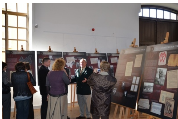
zdjęcie nr 5