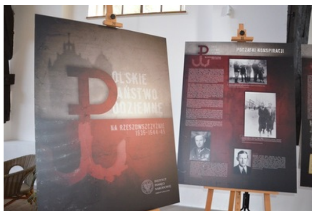
zdjęcie nr 2