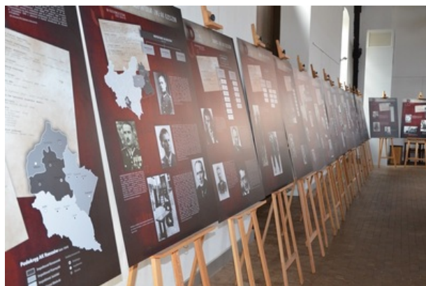
zdjęcie nr 4