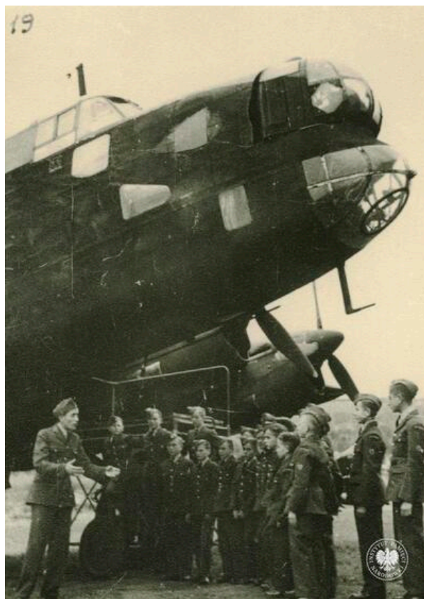
Kadeci Lotniczej Szkoły Technicznej dla Młodzieży obok samolotu bombowego Avro Lancaster.

Szczecin w drugiej połowie lat 30. XX w. przeżył dynamiczny rozwój. W czasie II wojny światowej ta stolica prowincji Pommern była jednym ze strategicznych ośrodków przemysłowy na terenie III Rzeszy. Znajdował się tu ważny port morski, stocznie Oderwerke i Vulkanwerf, zakłady samochodowe Stöwer, fabryka silników lotniczych Motorenbau GmbH oraz ok. 600 innych zakładów przemysłowych i 400 firm usługowych pracujących na potrzeby wojenne hitlerowskich Niemiec. W pobliskich Policach funkcjonowały zakłady chemiczne Hydrierwerke Pölitz AG produkujące paliwa syntetyczne z węgla kamiennego na potrzeby Wehrmachtu i Luftwaffe. Znaczne oddalenie od lotnisk skąd startowały alianckie bombowce zapewniało mu względne bezpieczeństwo.