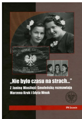
Nie było czasu na strach...

W 2018 r. IPN wydał książkę autorstwa Dariusza Jarosińskiego, Ta nasza wolność. Reportaże historyczne . Publikacja Dariusza Jarosińskiego jest zbiorem ponad sześćdziesięciu reportaży i esejów o losach żołnierzy polskiego podziemia niepodległościowego oraz o ich walce z komunistyczną dyktaturą. Jedne opowieści dotyczą postaci powszechnie znanych, zaś bohaterowie innych zostają dopiero przywracani społecznej pamięci. Autor starał się dotrzeć do ostatnich żyjących Żołnierzy Wyklętych, a ich relacje w miarę możliwości weryfikował i uzupełniał o źródła archiwalne i publikacje historyków. Część tekstów dotyczy także mało znanych lub zupełnie nieznanymi młodzieżowych grup antykomunistycznych, które działały niedługo po zakończeniu wojny, ale też w latach siedemdziesiątych ubiegłego wieku.