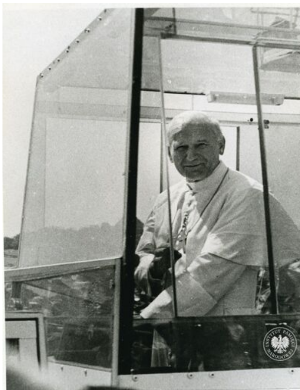
22 VI 83 KRAKÓW, JAN PAWEŁ II NA BŁONIACH II

Przebieg wizyty, podobnie jak podczas pierwszej pielgrzymki, starały się kontrolować władze komunistyczne, manifestacyjnie wykonując „gesty dobrej woli”. Z jednej strony funkcjonariusze aparatu represji przeprowadzili setki rozmów ostrzegawczych z opozycjonistami, zaostrzyli ich inwigilację, a nielicznych nawet zatrzymali. Z drugiej strony władze zgodziły