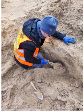
Krotoszyn: Odnaleziono dwie zbiorowe mogiły