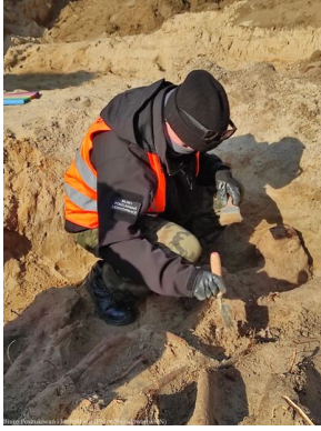
Krotoszyn: Odnaleziono dwie zbiorowe mogiły