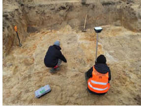
Krotoszyn: Odnaleziono dwie zbiorowe mogiły