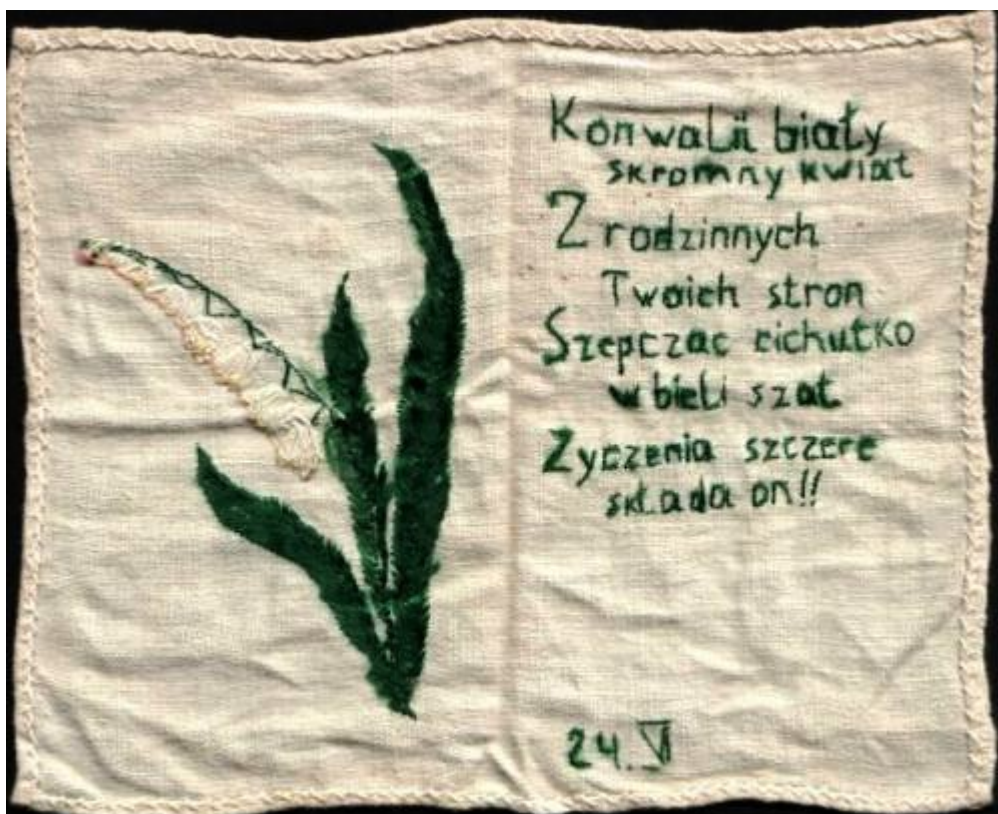
IPN Wr 100/1 Życzenia okolicznościowe wyszyte na płótnie

Kartka pocztowa adresowana do Józefy Czaplińskiej, 14.12.1947