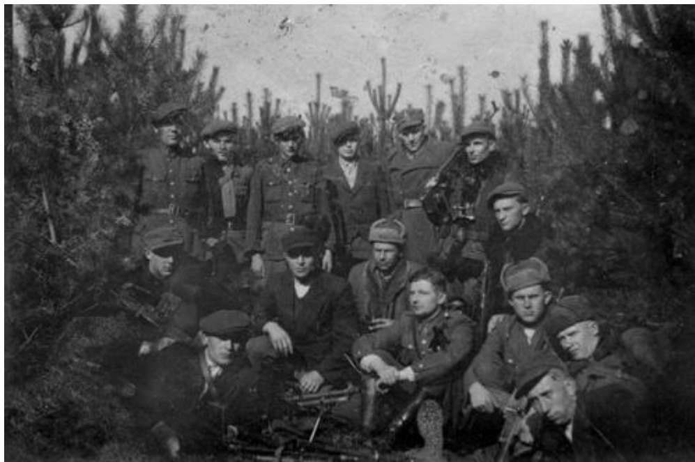
oddział "Uskoka" - fot. 1946 r.