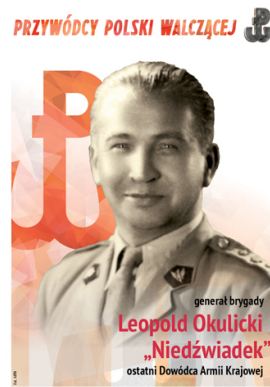
Gen. Leopold Okulicki „Niedźwiadek”