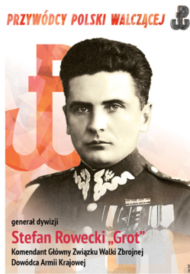
Gen. Stefan Rowecki „Grot”