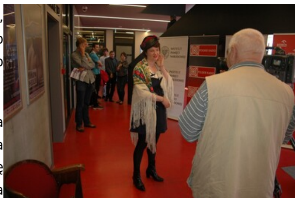
Pierwszy dzień festiwalu. Wywiad z brytyjską piosenkarką Katy Carr.