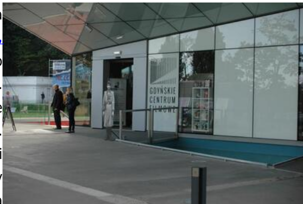
Festiwal NNW odbywał się w nowo otwartym Gdynskim Centrum Filmowym.

26 września br. zakończyła się VII edycja Festiwalu Niepokorni, Niezłomni, Wyklęci . Festiwal gościł w murach nowo otwartego Gdynskiego Centrum Filmowego. W trakcie gali finałowej wręczono prestiżowe nagrody dla twórców filmowych i radiowców. Wśród gości festiwalu obecni byli bohaterowie - Żołnierze Wyklęci, walczący po wojnie o niepodległą i demokratyczną Polskę. Festiwal został objęty honorowym patronatem Prezydenta RP Andrzeja Dudy.