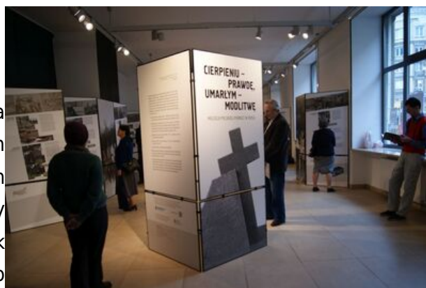
Wystawę „Cierpieniu prawdę, umarłym modlitwę. Miejsca polskiej pamięci w Rosji” można oglądać w centrum edukacyjnym IPN do końca kwietnia 2015

Większość pomników prezentowanych na wystawie powstała z inicjatywy byłych więźniów i deportowanych oraz ich potomków lub rosyjskiej Polonii przy wsparciu polskich placówek dyplomatycznych. W wielu wypadkach to polska pamięć jest czynnikiem inicjującym w procesie upamiętniania wspólnych także dla Rosjan i innych narodowości miejsc pamięci o ofiarach terroru sowieckiego.