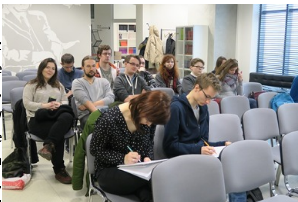
Warsztaty dla studentów Instytutu Historii Uniwersytetu Śląskiego na temat Tragedii Górnos Śląskiej.