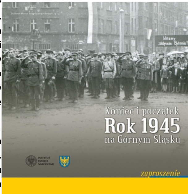
Wystawa „Koniec i początek. Rok 1945 na Górnym Śląsku”.