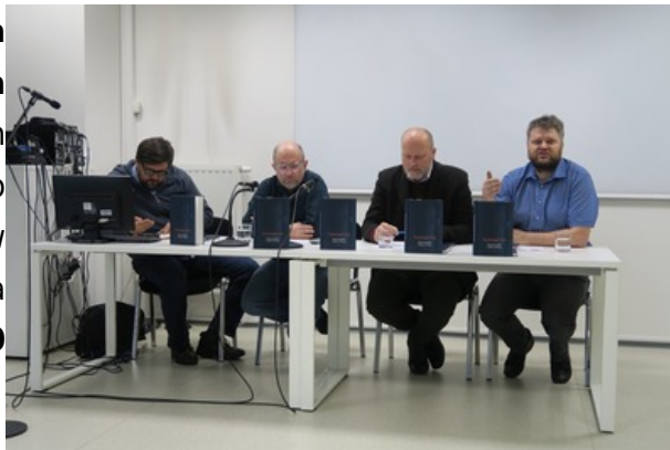
Warsztaty dla studentów Instytutu Historii Uniwersytetu Śląskiego na temat Tragedii Górnos Śląskiej.