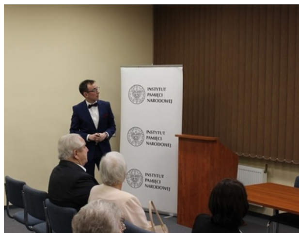
Spotkanie w poznańskim oddziale IPN