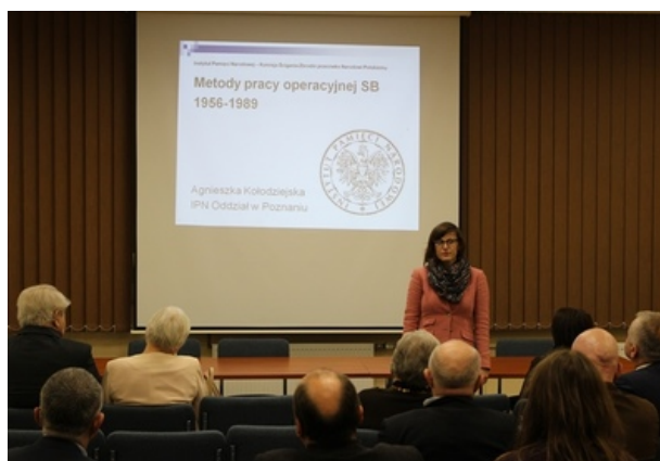
Spotkanie w poznańskim oddziale IPN