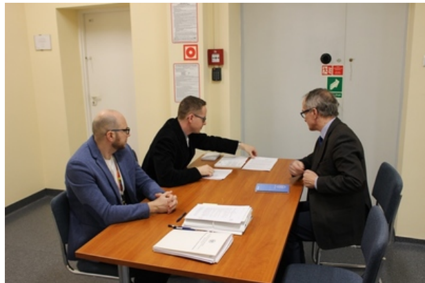
Spotkanie w poznańskim oddziale IPN