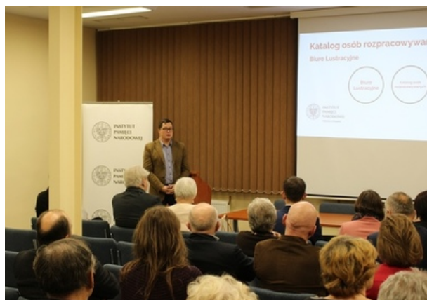
Spotkanie w poznańskim oddziale IPN