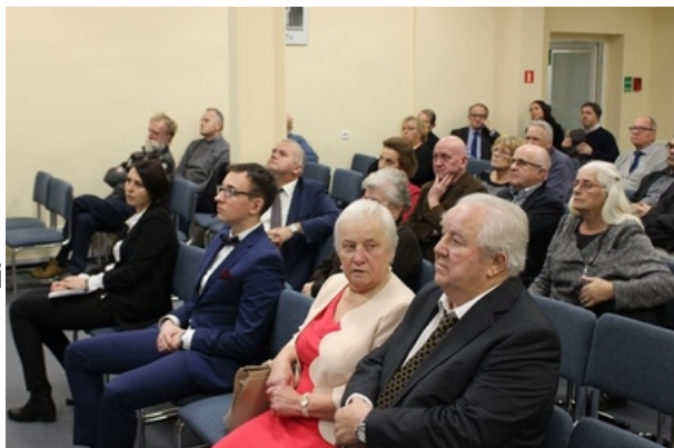
Spotkanie w poznańskim oddziale IPN

Spotkanie miało charakter informacyjny. Pracownicy IPN zachęcali zaproszonych gości do wyrażenia zgody na publikację danych w katalogu. Zaprezentowane zostały również metody pracy operacyjnej Służby Bezpieczeństwa PRL. Ponadto pracownicy Oddziałowego Archiwum IPN w Poznaniu przekazali informację na temat ustawy o działaczach opozycji antykomunistycznej oraz o Krzyżach Wolności i Solidarności. Osoby, które przyszły na spotkanie dowiedziały się, na jaką pomoc od Państwa mogą liczyć w związku z represjami jakich doświadczyli w PRL-u.