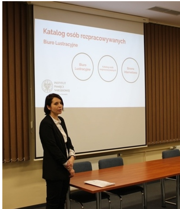
Spotkanie w poznańskim oddziale IPN