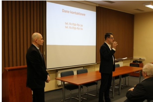
Spotkanie w poznańskim oddziale IPN