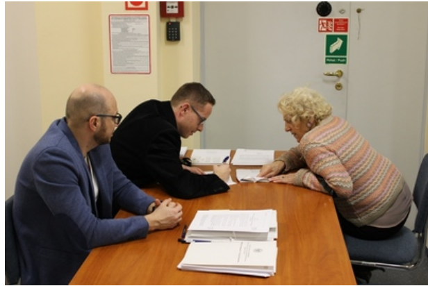
Spotkanie w poznańskim oddziale IPN