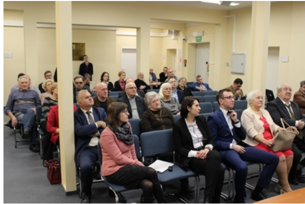
Spotkanie w poznańskim oddziale IPN