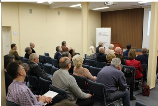
Spotkanie w poznańskim oddziale IPN