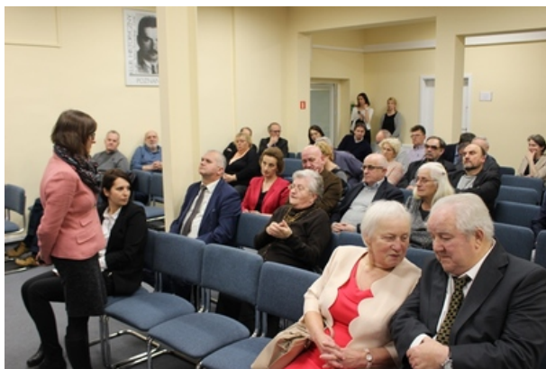
Spotkanie w poznańskim oddziale IPN