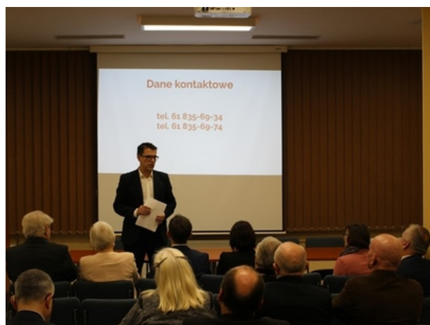
Spotkanie w poznańskim oddziale IPN