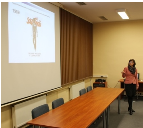
Spotkanie w poznańskim oddziale IPN