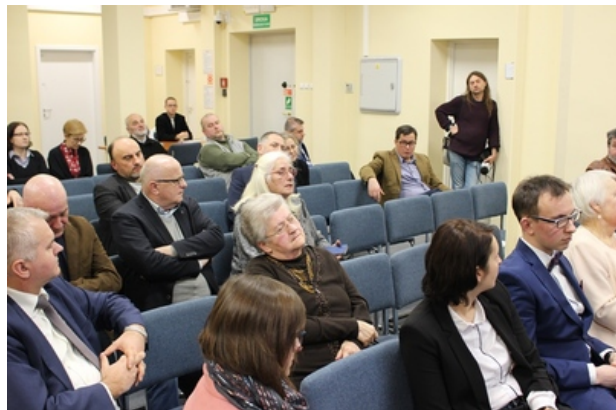
Spotkanie w poznańskim oddziale IPN