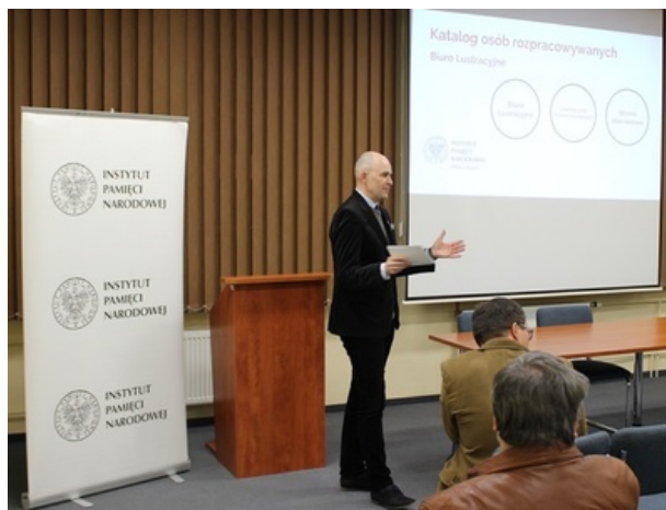
Spotkanie w poznańskim oddziale IPN

W katalogu umieszczane są osoby, które działały w latach 1944-1989 na rzecz niepodległego bytu Państwa Polskiego i w obronie wolności oraz godności ludzkiej, a także osoby represjonowane przez komunistyczny reżim, o których informacje zachowały się w zasobie IPN. Publikując ww.