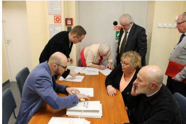
Spotkanie w poznańskim oddziale IPN