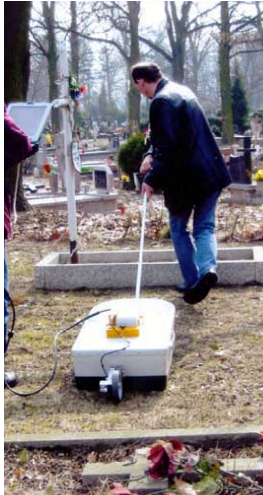
Wykonywanie pomiarów przy pomocy georadaru RAMAC/GPR.

możliwe jest odnalezienie nieznanych jeszcze miejsc pochówków. Te nowe ustalenie oraz perspektywy dalszych badań były głównym przedmiotem konferencji prasowej.