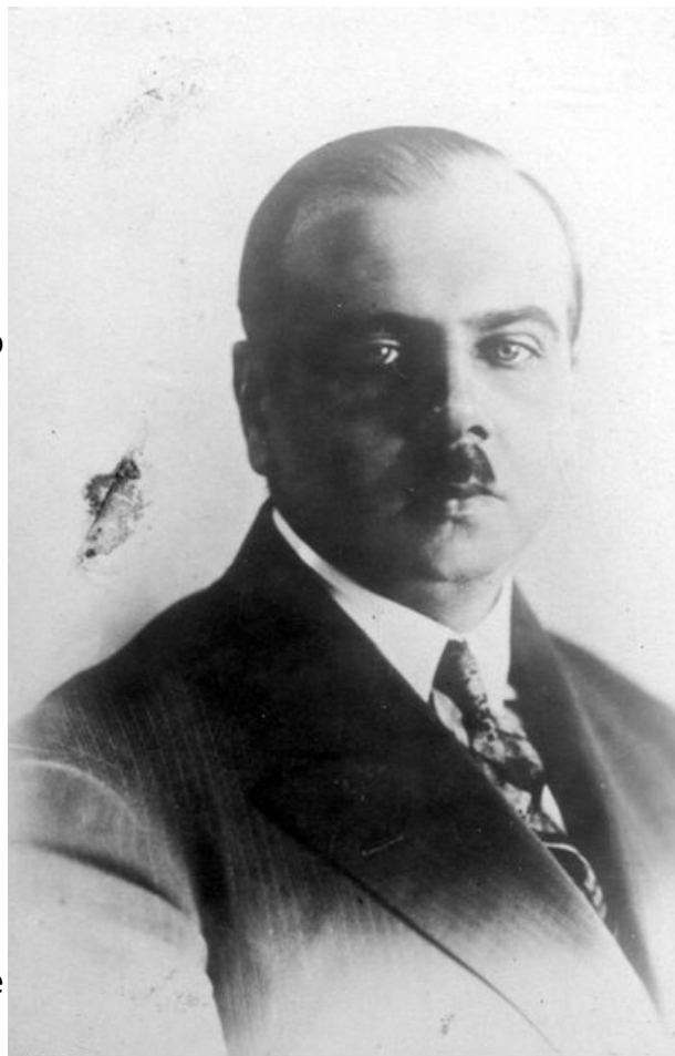
ptk Ignacy Matuszewski

Henryk Floyar-Rajchman od 1913 roku należał do Związku Strzeleckiego. Po wybuchu I wojny służył w 5. pułku piechoty Legionów, a po kryzysie przysięgowym – w