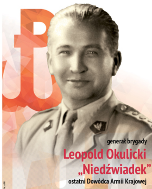
generał brygady Leopold Okulicki „Niedźwiadek” ostatni Dowódca Armii Krajowej