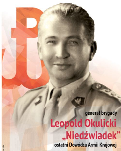
generał brygady Leopold Okulicki „Niedźwiadek” ostatni Dowódca Armii Krajowej