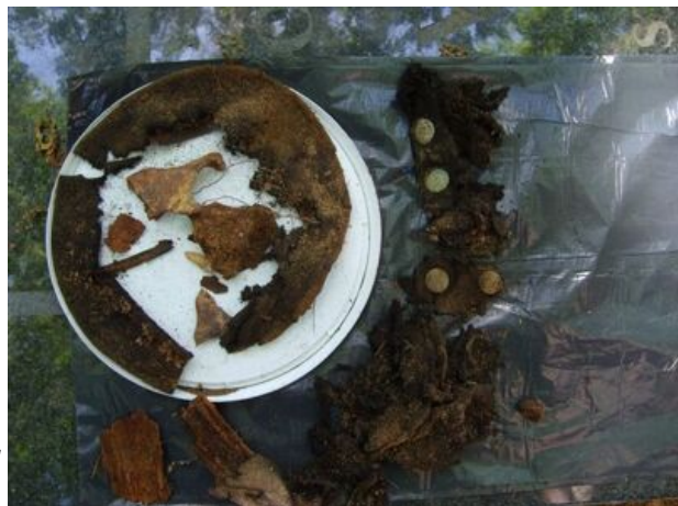
Ekshumacja na Cmentarzu Osobowickim 2.06.2008