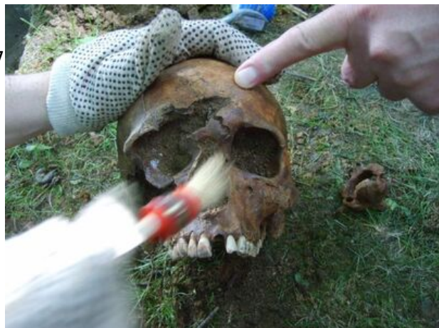
Ekshumacja na Cmentarzu Osobowickim 2.06.2008