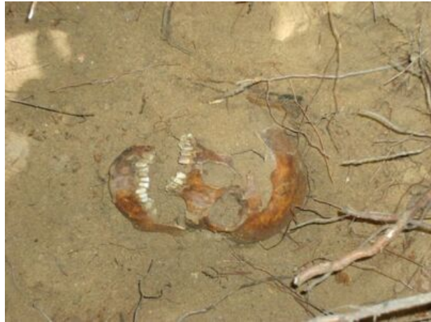
Ekshumacja na Cmentarzu Osobowickim 2.06.2008

Cmentarz Osobowicki jest prawdopodobnie jedynym w Polsce, gdzie zachowały się w prawie niezmienionym kształcie kwatery więźniów – ofiar terroru komunistycznego. W latach 1945–1956 na 22 polach pochowano blisko 840 osób, ale do ujawnienia faktu istnienia na cmentarzu kwater więźniów okresu stalinowskiego doszło dopiero w 1987 roku. W kwaterach tych pochowano m.in. członków WiN, oficerów Wojska Polskiego i żołnierzy Armii Andersa, uczestników Powstań Śląskich i Powstania Warszawskiego, żołnierzy z Brygady Świętokrzyskiej NSZ oraz uczestników wojny polsko-bolszewickiej z 1920 roku.