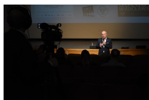
Inauguracja IX edycji Kieleckiego Przeglądu Polskich Filmów Fabularnych „Historia w filmie” i projekcja filmu „Golgota wrocławska” – Kielce, 16 kwietnia 2024 r