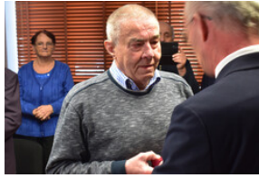
Uroczystość wręczenia Krzyży Wolności i Solidarności – Opole, 16 listopada 2023.