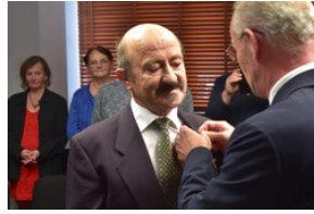
Uroczystość wręczenia Krzyży Wolności i Solidarności – Opole, 16 listopada 2023.