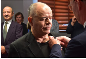
Uroczystość wręczenia Krzyży Wolności i Solidarności – Opole, 16 listopada 2023.