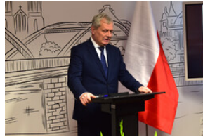
Wojewoda opolski Sławomir Krzowski.