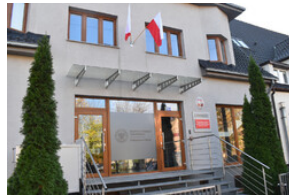
Nowa siedziba Delegatury IPN w Opolu przy ul. Augustyna Košnego 62.