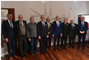
Uroczystość wręczenia Krzyży Wolności i Solidarności – Opole, 16 listopada 2023.