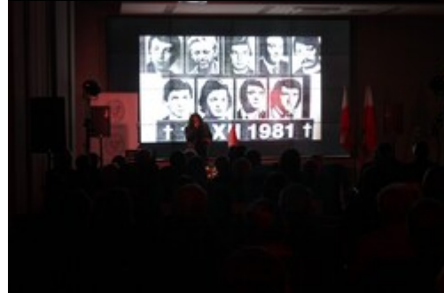
25 września 2017 r. w siedzibie lubelskiego oddziału IPN (ul. Wodopojna 2) odbyło się wręczenie odznaczeń państwowych – Krzyży Wolności i Solidarności zasłużonym działaczom