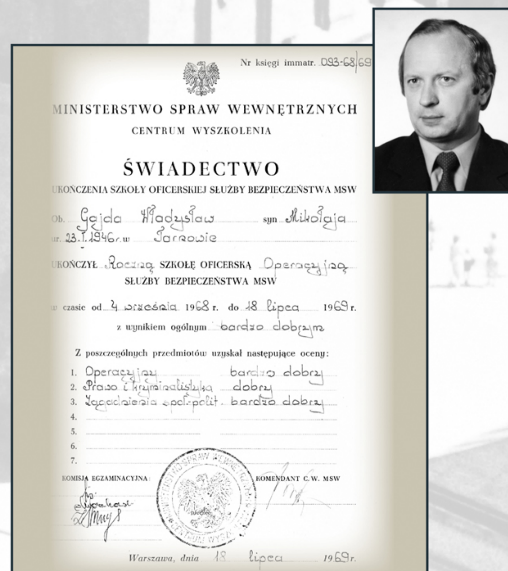
Świadectwo ukończenia przez Władysława Gajdę Szkoły Oficerskiej SB MSW