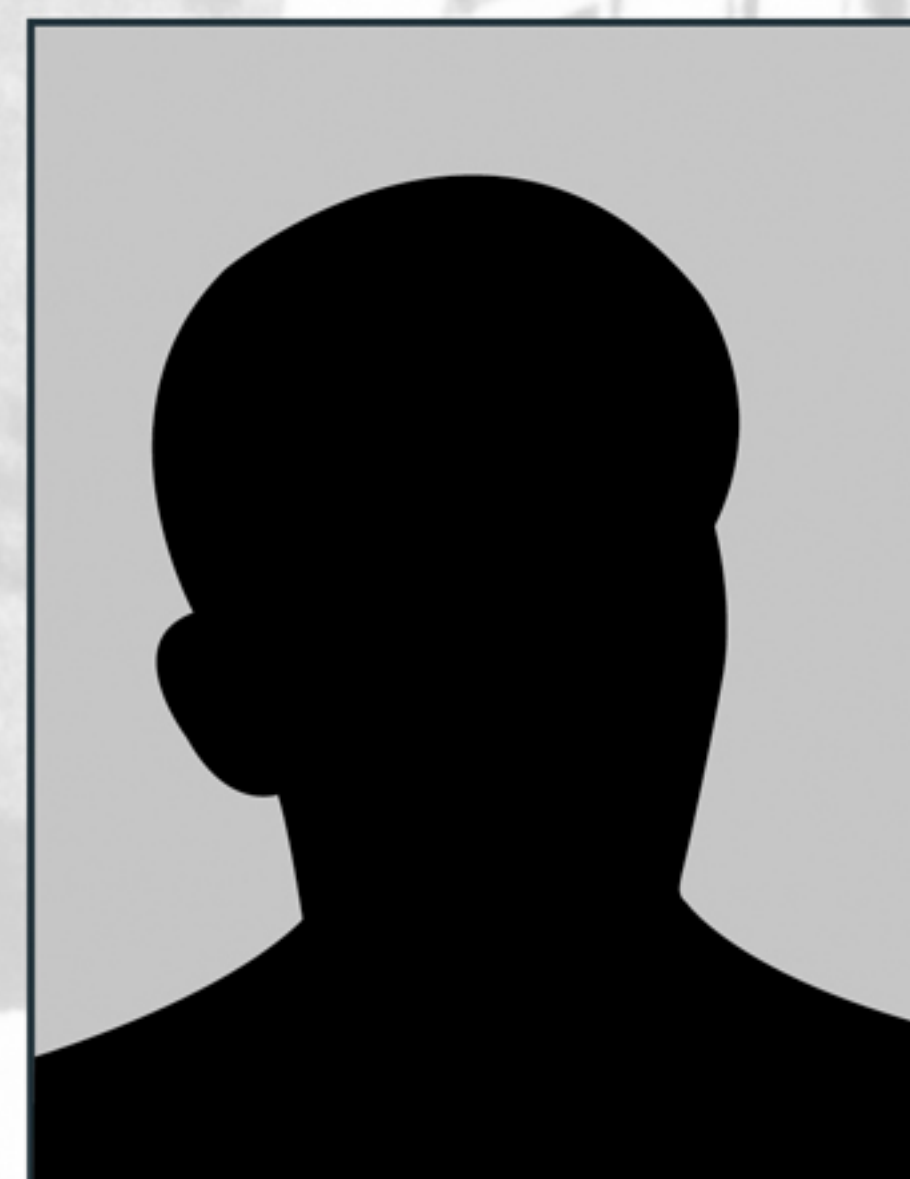
kpt. STANISŁAW NOWICKI s. Stefana ur. 28 X 1946 r. p.o. naczelnik Wydziału „C” SB WUSW w Tarnowie – od 16 III do 31 V 1990 r.