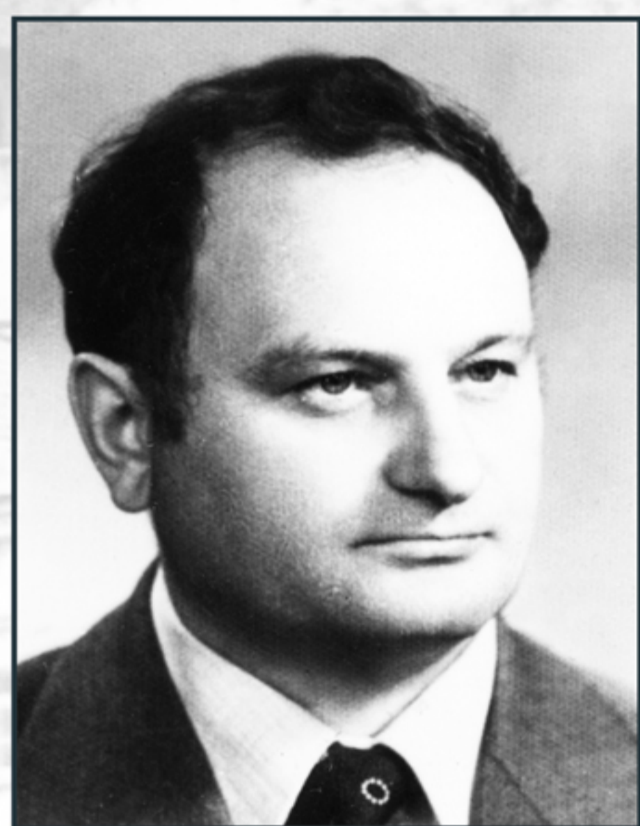
mjr/ppłk/plk BOLESŁAW PAJDAK s. Józefa ur. 17 I 1932 r. naczelnik Wydziału II SB KW MO/WUSW w Tarnowie – od 1 IX 1975 do 31 VIII 1983 r.