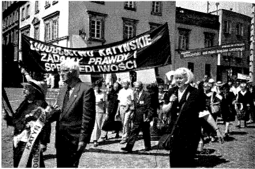
31. Czarna Procesja po Sesji Katyńskiej, 28 maja 2005 r. prowadzona pod hasłem – Ludobójstwo katyńskie. Żądamy prawdy i sprawiedliwości.