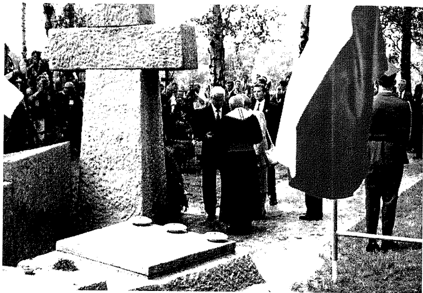
12. Prezydent Borys Jelcyń przy Pomniku Katyńskim, Warszawa, Powązki, Dolinka Katyńska, sierpień 1993 r.