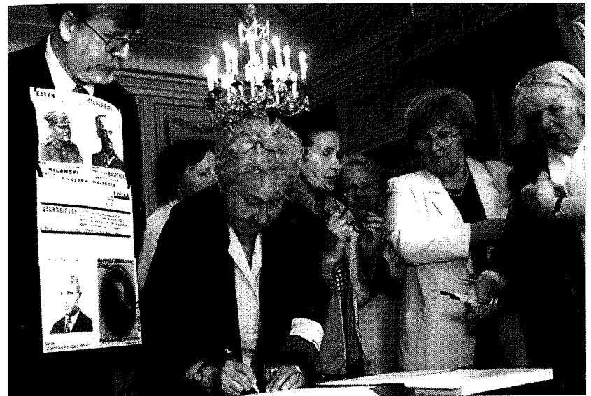
34. Sesja Katyńska, maj 2006 r. Podpisywanie Apelu Katyńskiego – przesłanie dla przyszłości