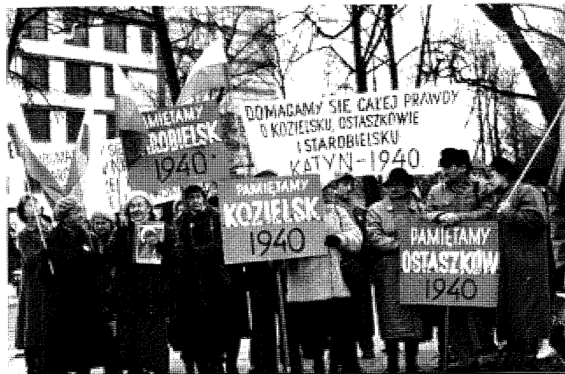
2. Środowiska Katyńskie domagające się prawdy o Zbrodni Katyńskiej pod ambasadą ZSRR, 2 marca 1990 r.