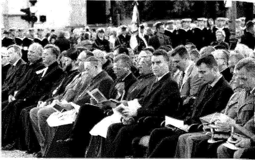
27. Audytorium – uczestnicy uroczystości odsłonięcia Kaplicy Katyńskiej w Katedrze Polowej WP, 15 września 2002 r.