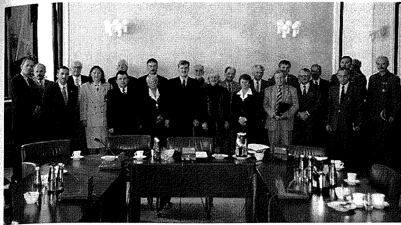
21. Posiedzenie Komitetu Organizacyjnego, uroczystości odsłonięcia cmentarzy katyńskich, Urząd Rady Ministrów, sierpień 2000 r.