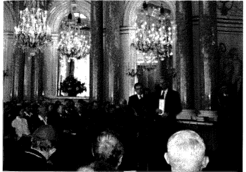
18. Premier Jerzy Buzek przemawia na uroczystej prezentacji Księgi Cmentarnej Katynia, Zamek Królewski, kwiecień 2000 r.