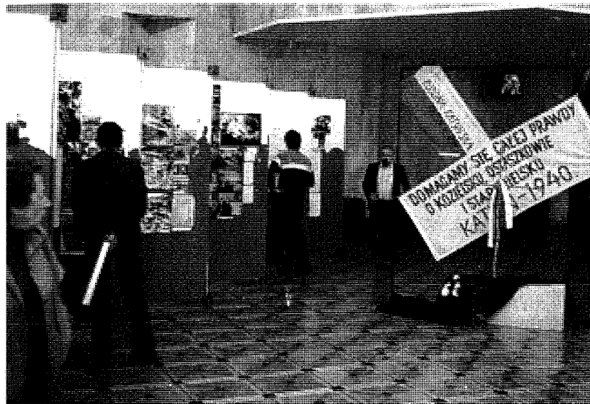
Fragmenty moskiewskiej wystawy „Zginęli w Katyniu”.